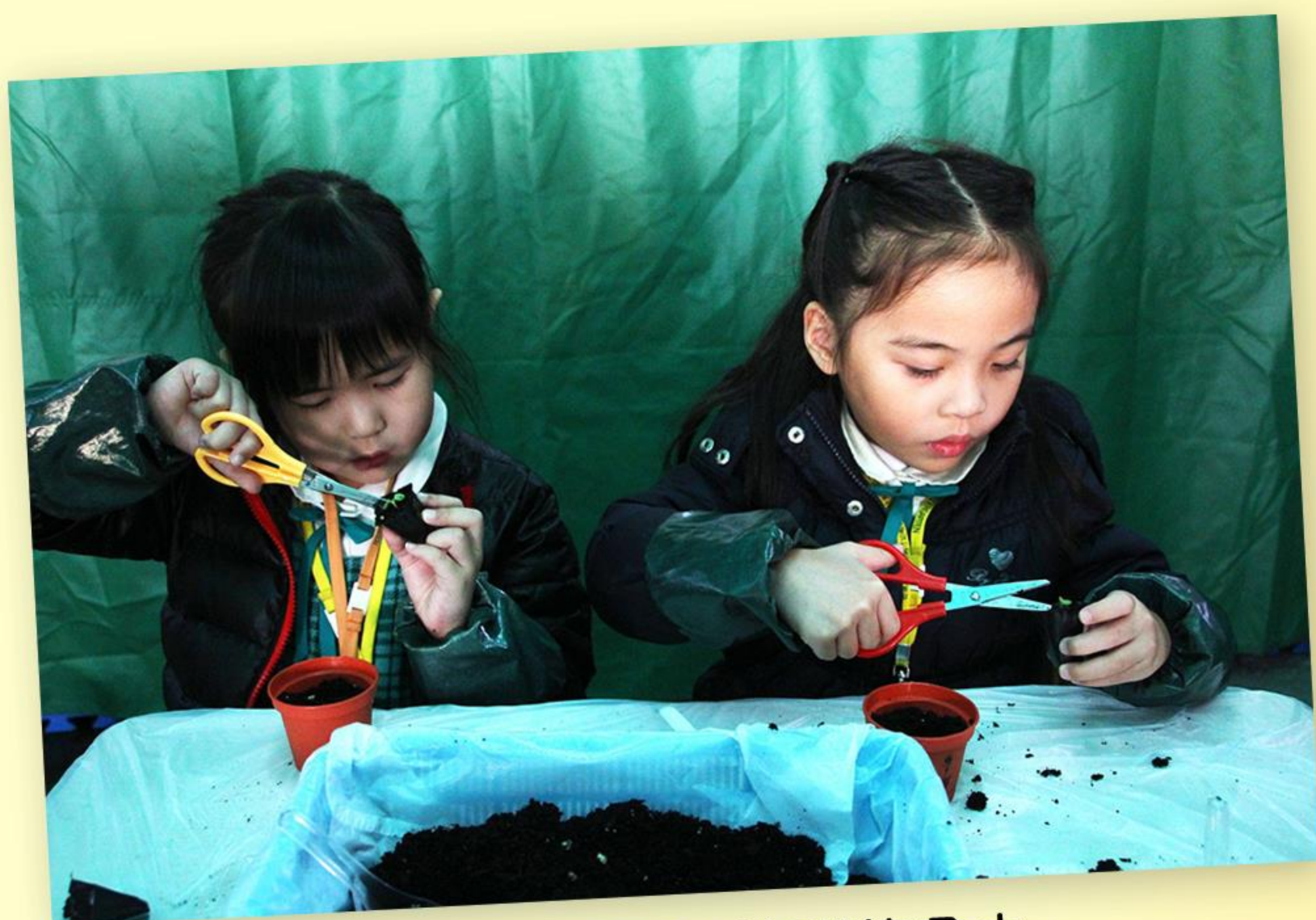
兒童學習把幼苗移植到花盆中。