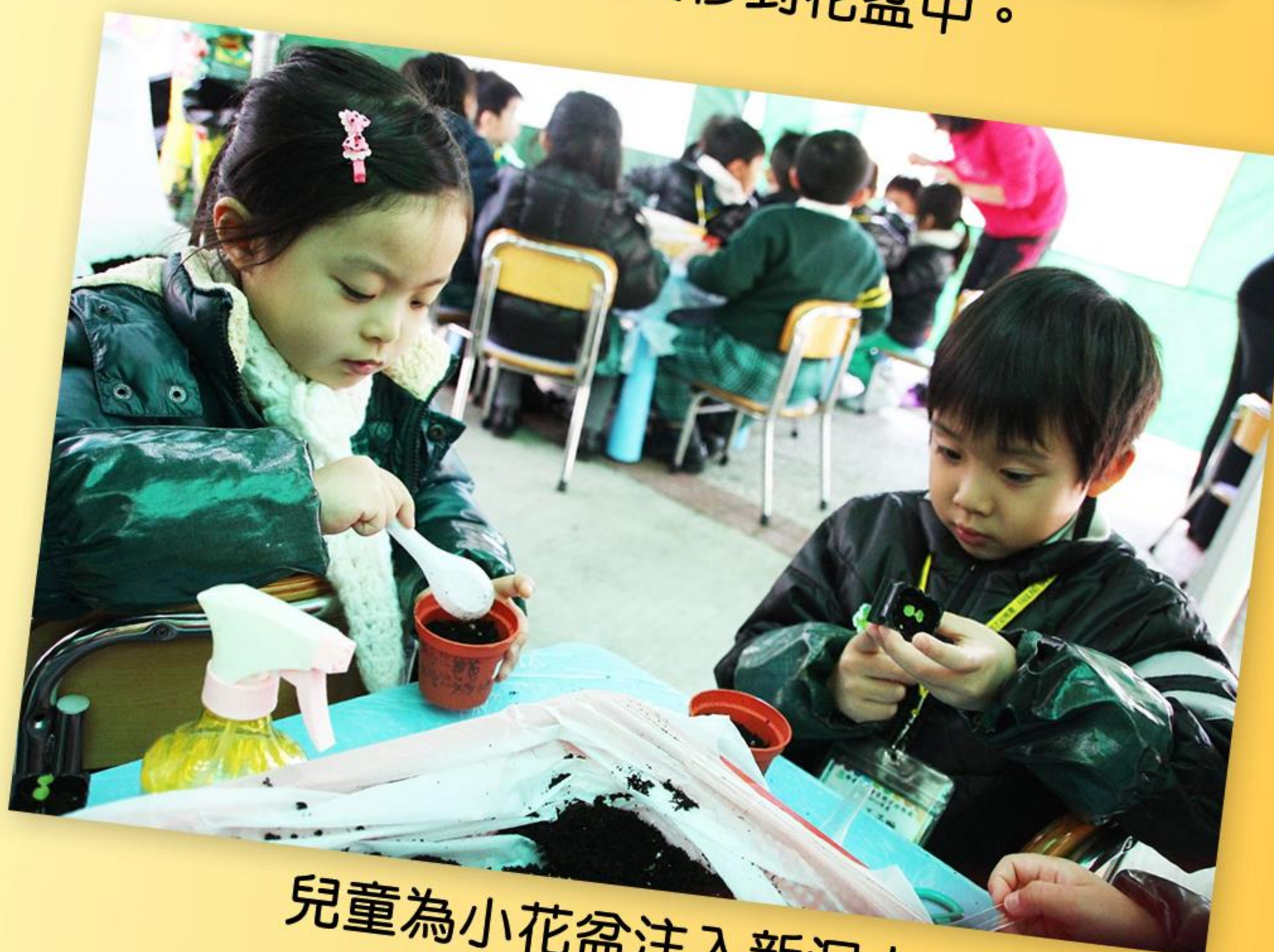
兒童為小花盆注入新泥土。