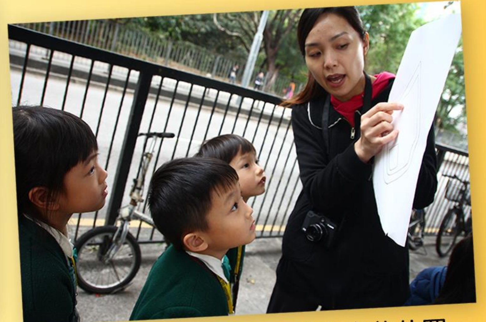
老師指出兒童在地圖上所身處的位置。

為配合「環保」的主題，高班兒童在「德育週」中合作製作回收箱，並且把回收箱帶到低、幼班中作推廣，讓全校兒童也認識到「循環再用，珍惜資源」的重要性。