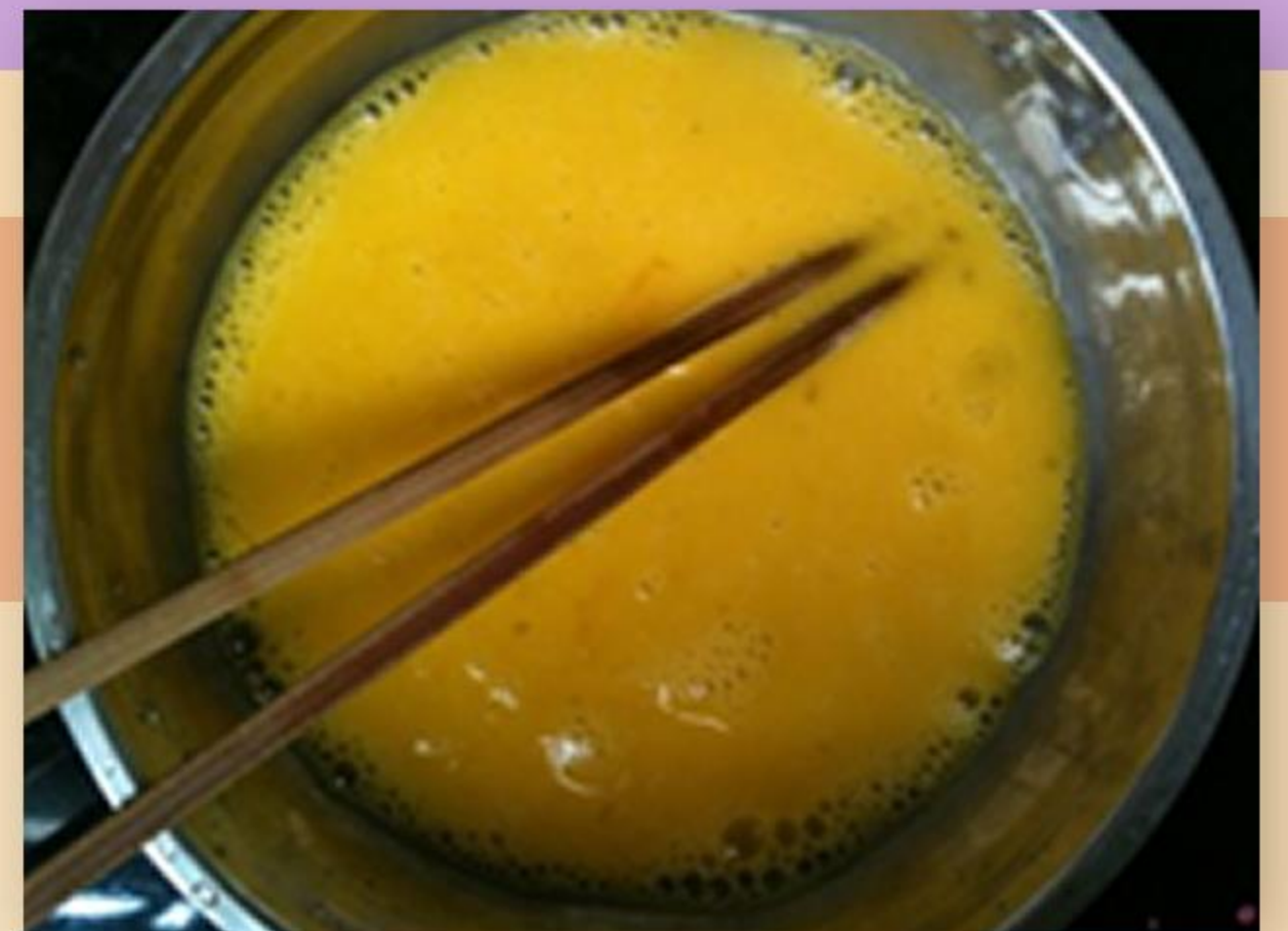
2. 拌勻蛋，加入糖、鮮奶成蛋漿。