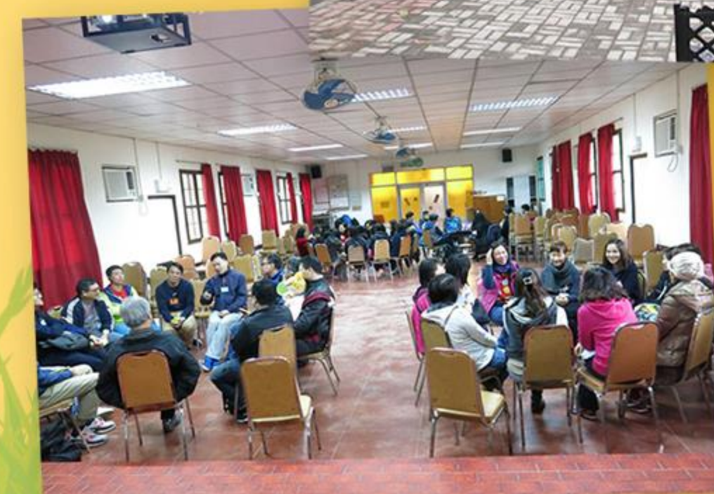
分組討論，家長交流教養心得。