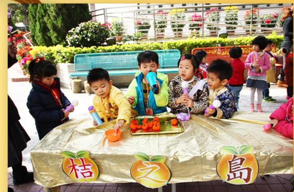
兒童自創大桔進行模擬買賣。