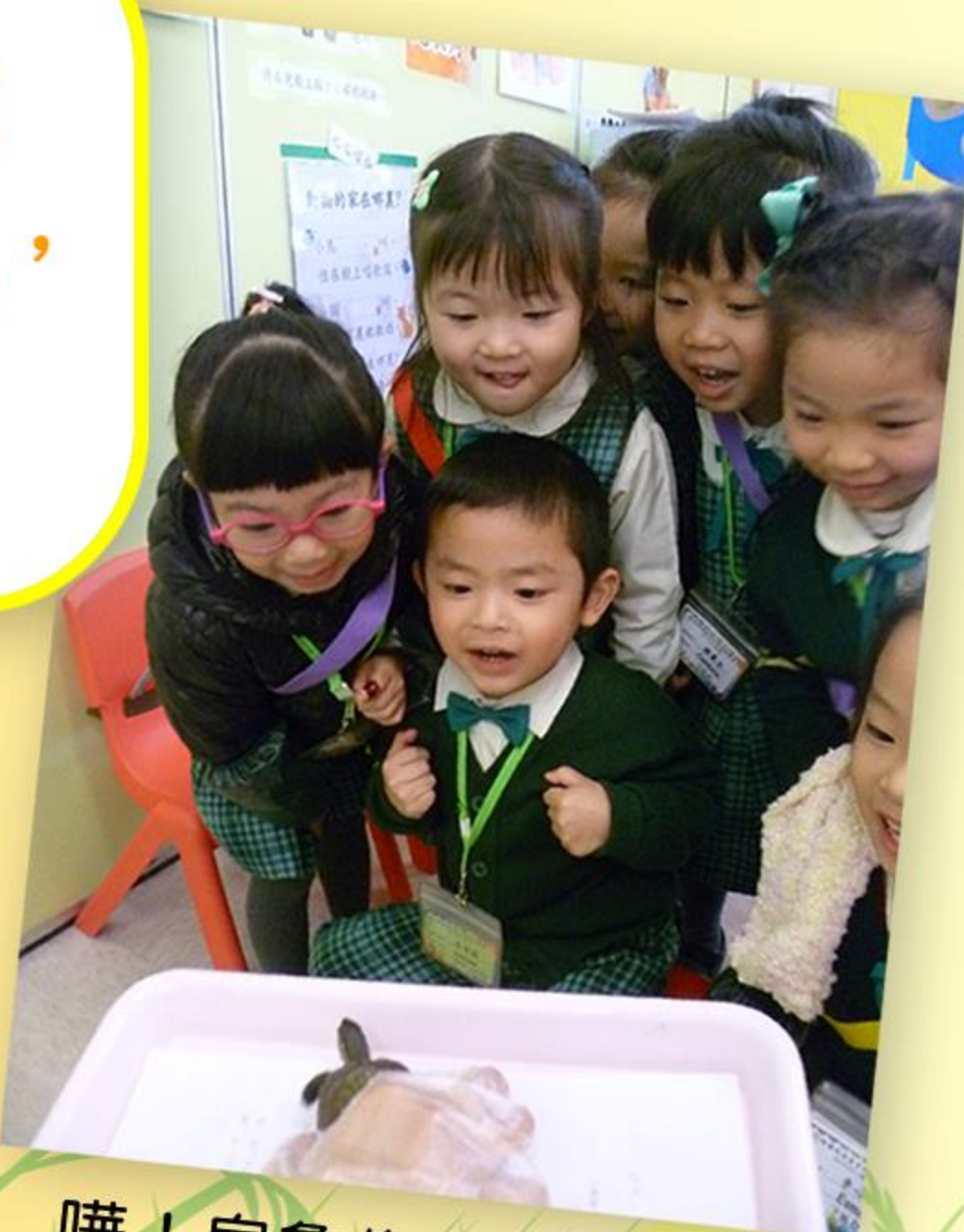
嘩！烏龜像是要爬過來。