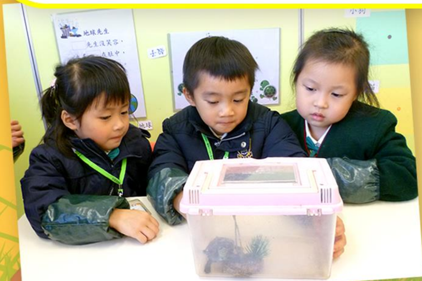
兒童們一起觀察烏龜的外型特徵。

在有關寵物的主題中，兒童一起在學校飼養小烏龜，不但在分組時與烏龜傾談，還會觀察牠的動態，真有趣！