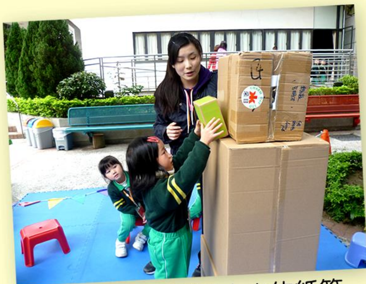
兒童探索把不同大小的紙箱疊高而不致倒下的方法。