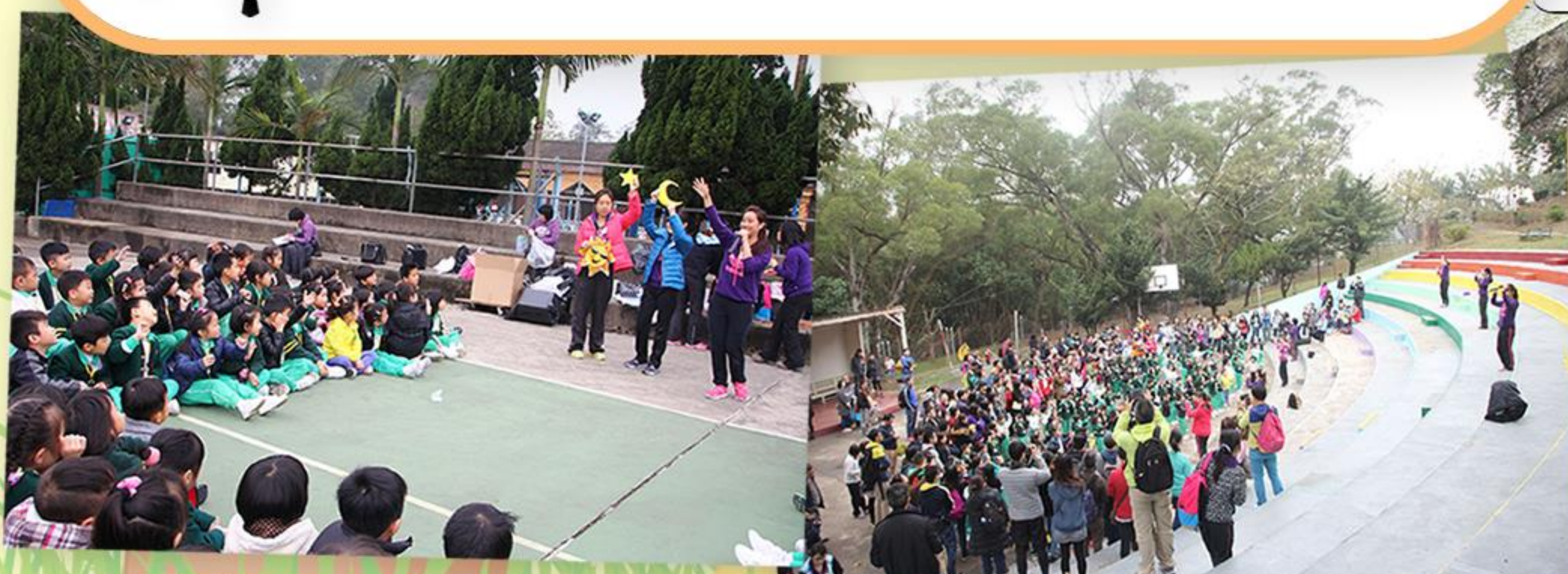
兒童專心聆聽聖經故事。