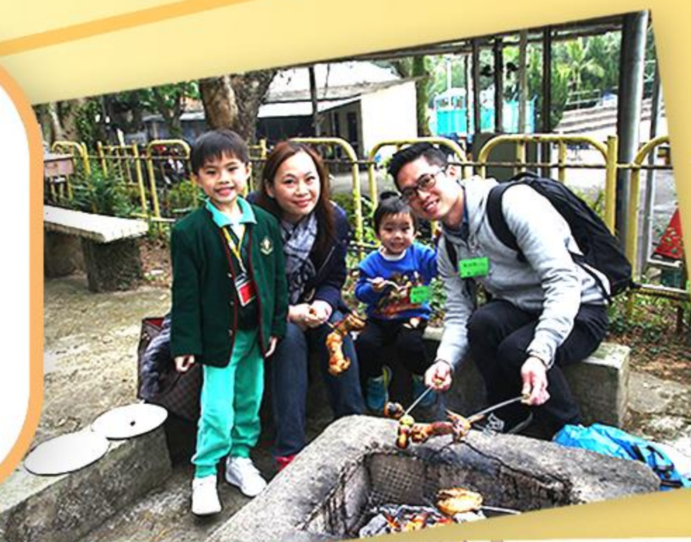
一家人一起燒烤，很開心啊！