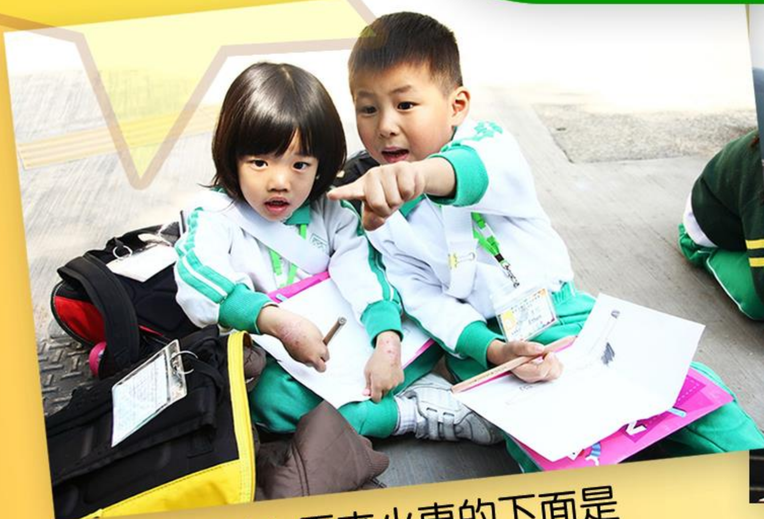
「你看！原來火車的下面是黑漆漆的。」

兒童在主題「假日遊香港」的活動中，不但學習籌劃前往參觀「香港鐵路博物館」的注意事項，而且學習把參觀中的所見所聞以繪畫形式記錄下來。