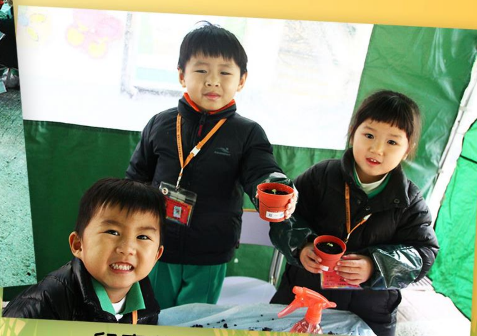
兒童將盆栽帶回家種植。