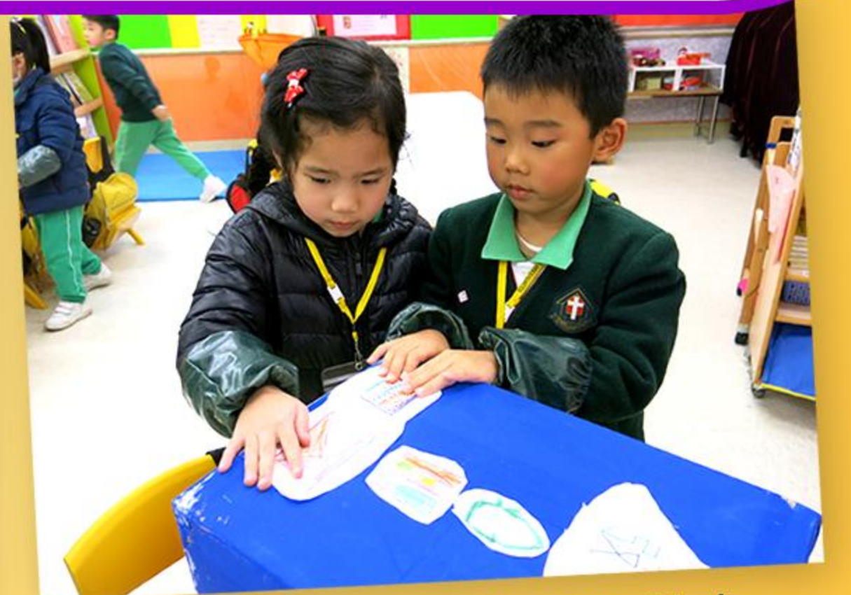
兒童合作在回收箱上貼上文字和標誌。