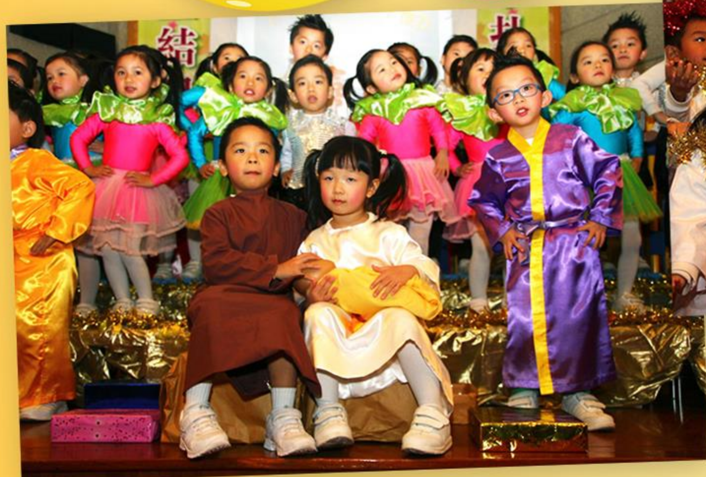
兒童以歌舞演出聖景。