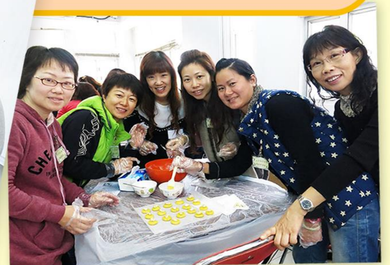
「這是我們的製成品——腰果酥。」