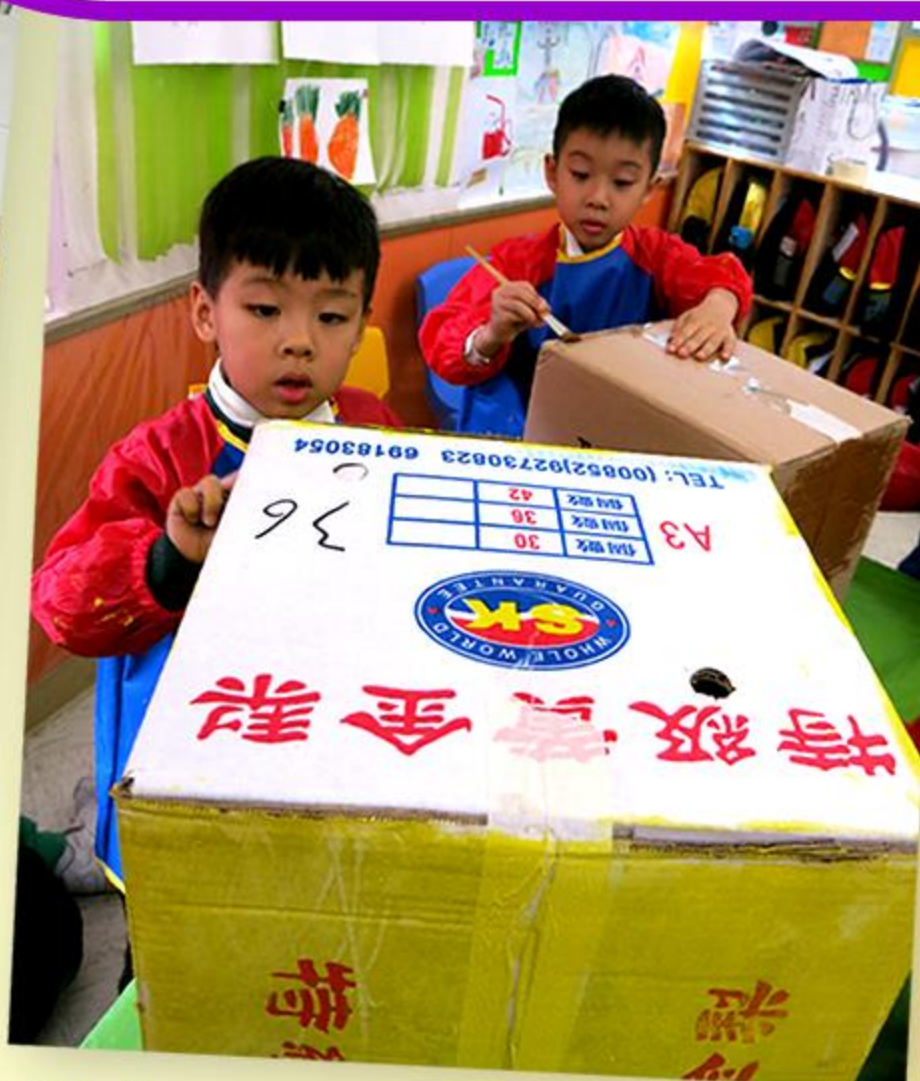
「藍廢紙，黃鋁罐，啡膠樽。」齊來製作回收箱。