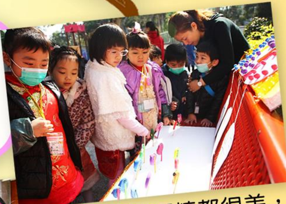
「每枝波板糖都很美，選擇那一枝好呢？」