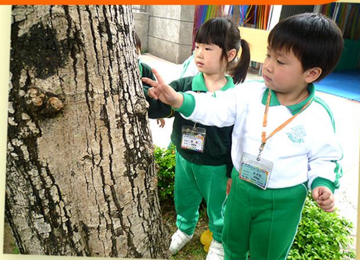
「讓我摸一摸大樹的樹幹。」