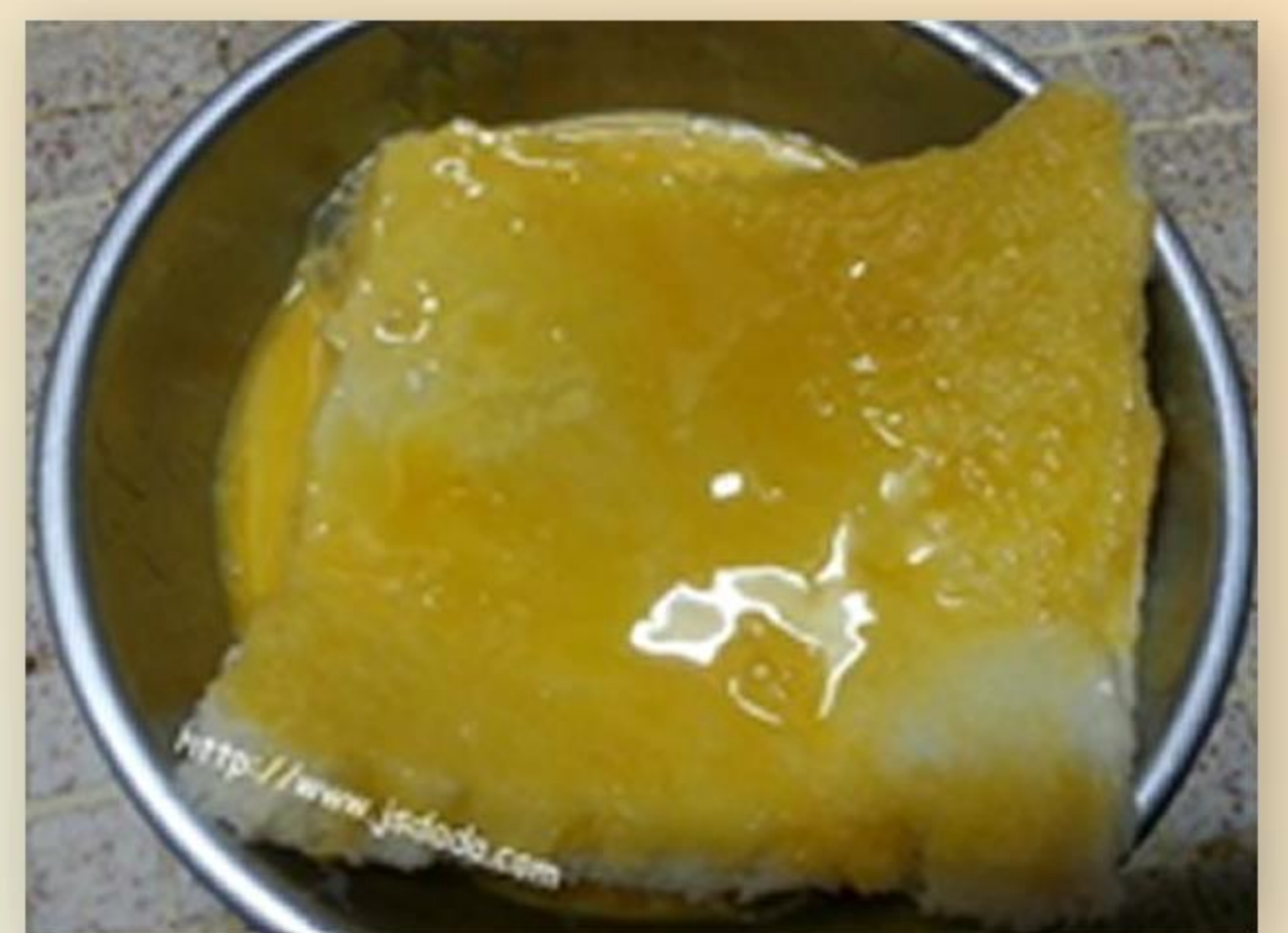
3. 將方包浸入蛋漿內。