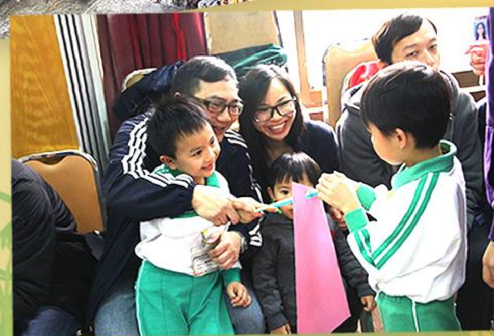
充滿溫馨快樂的親子遊戲。