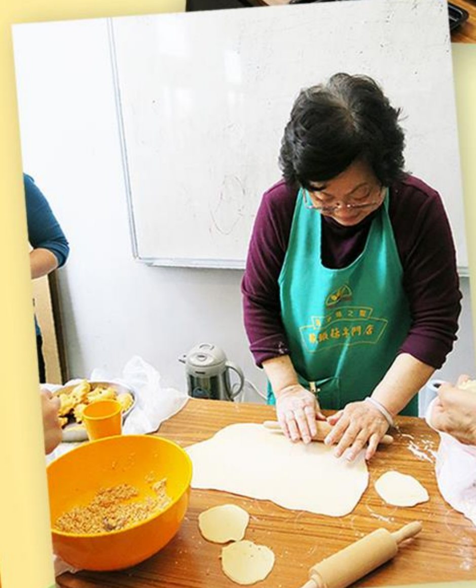
家長示範傳統角仔的製作方法。