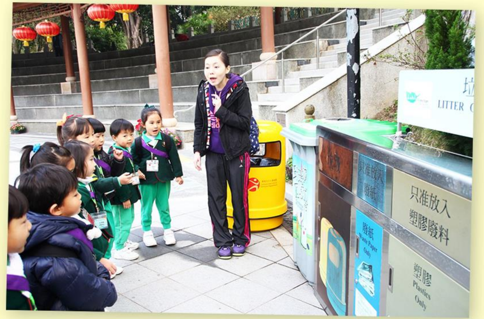
兒童親身到北區公園認識回收箱。