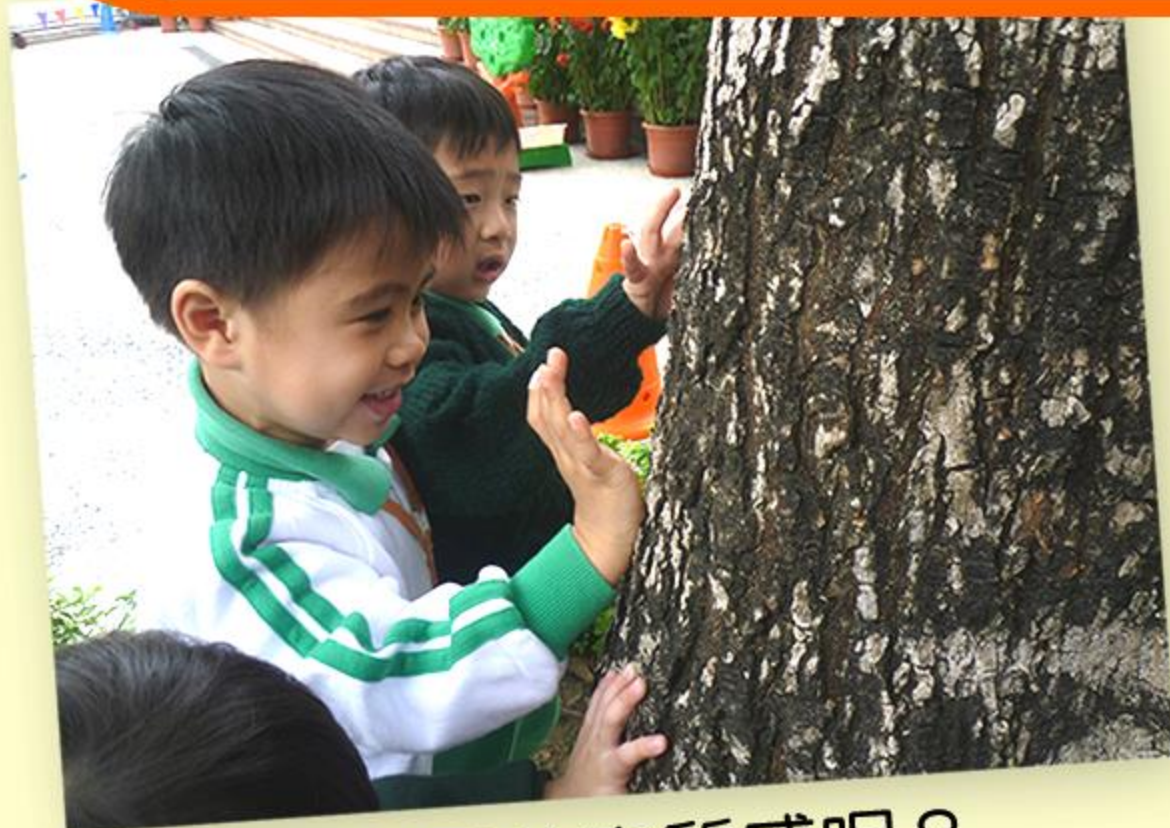
大樹是什麼質感呢？

在「大樹伯伯的禮物」這主題中，兒童透過觀察校園中的大樹，認識大樹的外形特徵，並合作利用紙箱砌成大樹，再在所創作之大樹下乘涼。