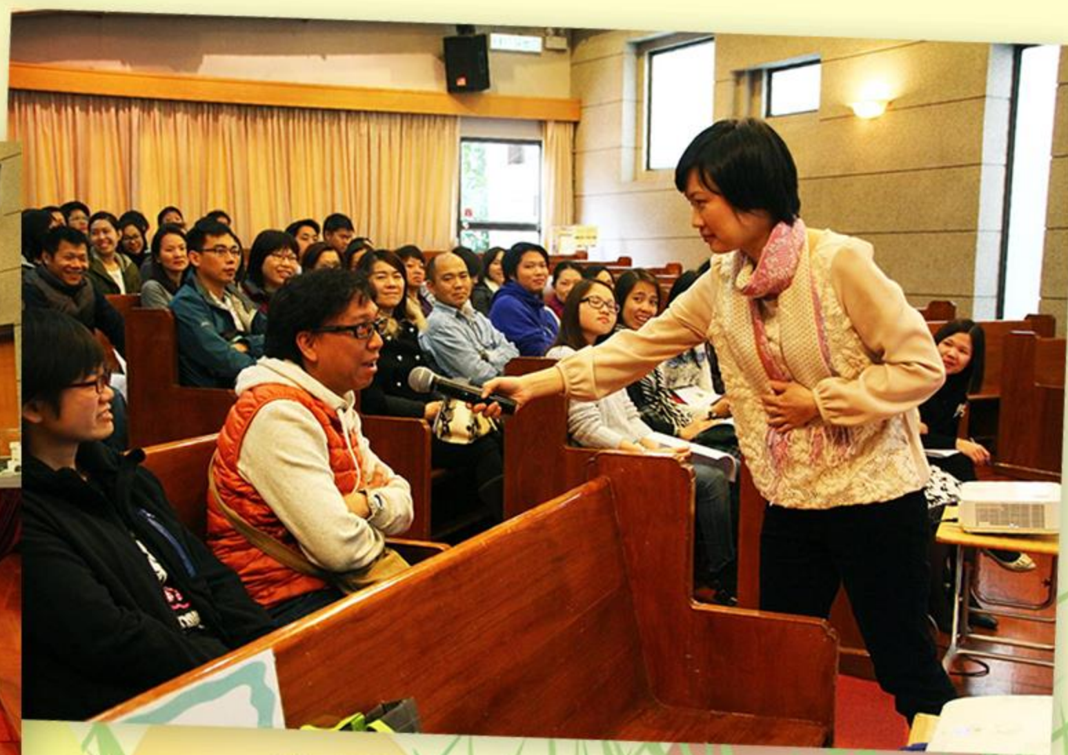
家長分享生活經驗。