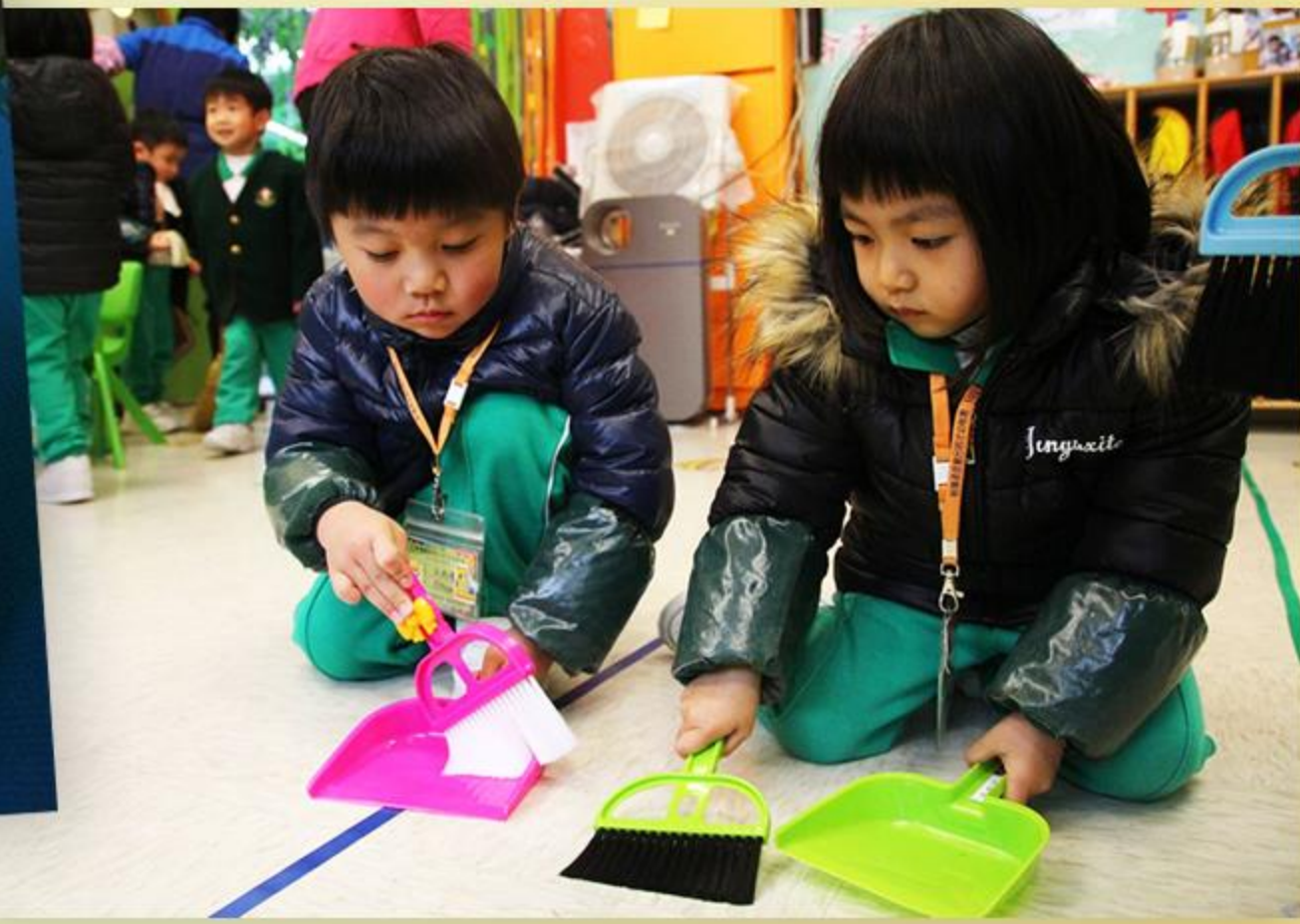
同學們仔細地把地上的垃圾掃走。