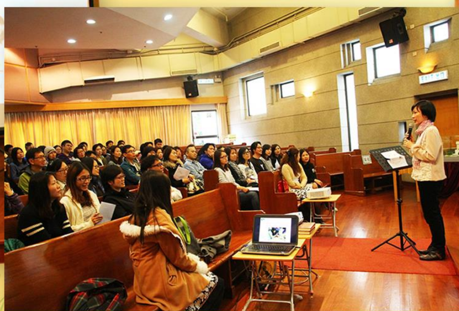
家長們全神貫注地聆聽。