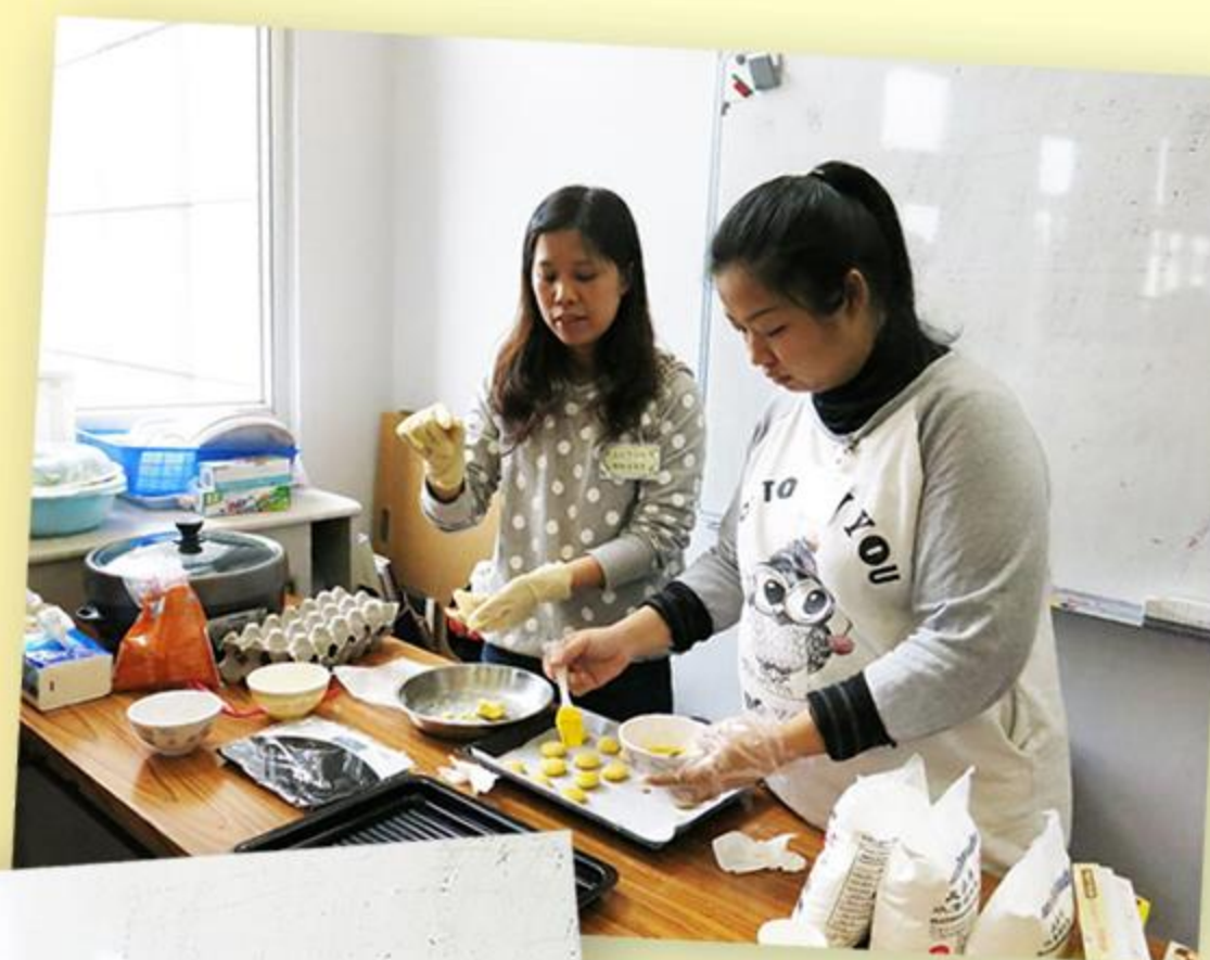
家長講解腰果酥的製作過程。