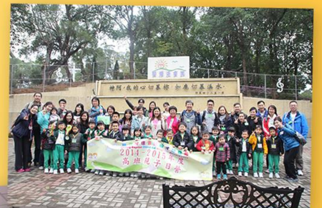
大家一起拍照留念。