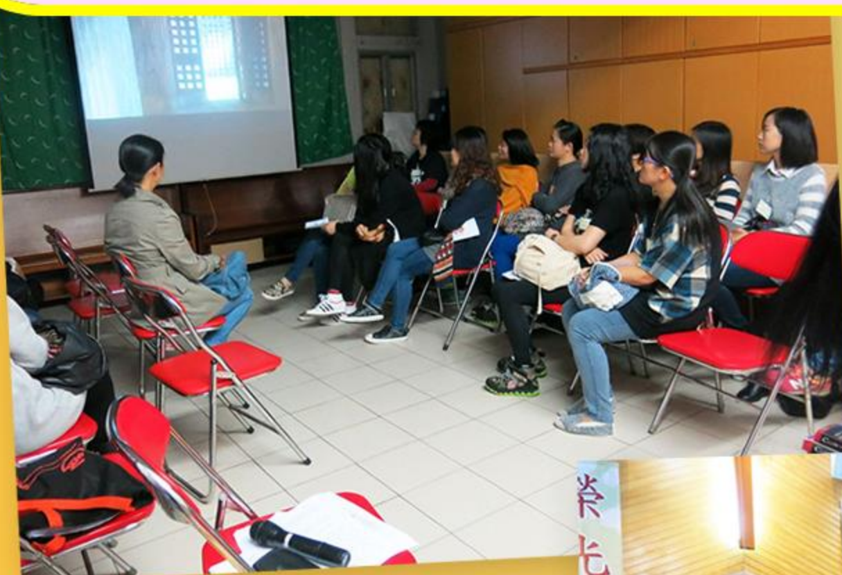
家長透過電影欣賞，認識復活節的真正意義。