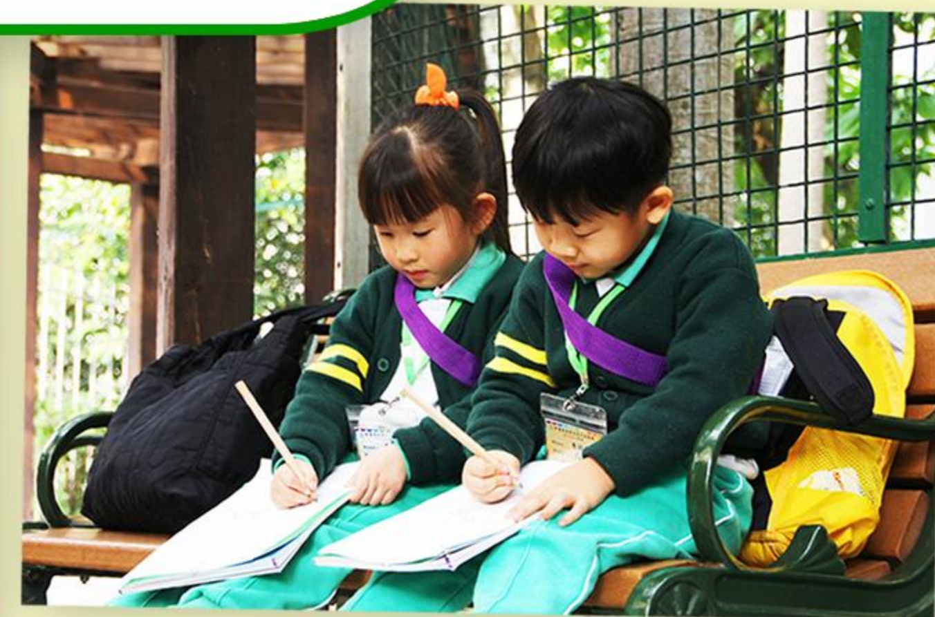
兒童以寫生形式把舊式火車繪畫下來。