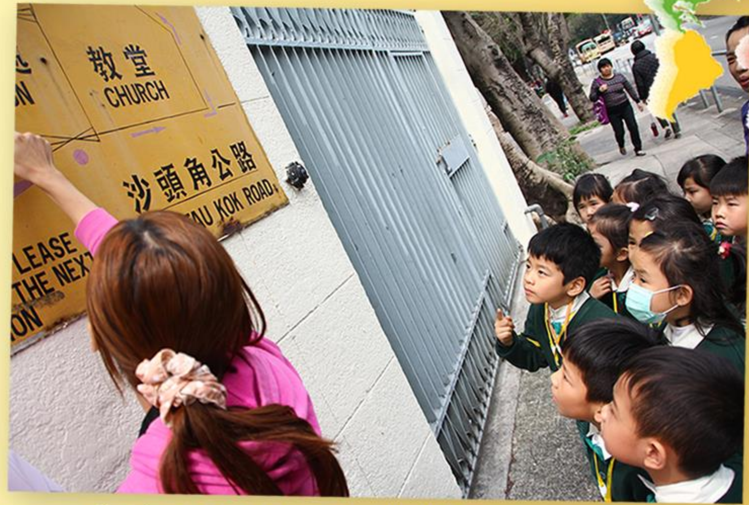
兒童觀察地圖上的指示向前行。

為讓兒童認識學校的社區設施、學習閱讀及製作地圖，老師於課堂時間帶領學生出外考察，以加深他們對學校附近環境的認識。