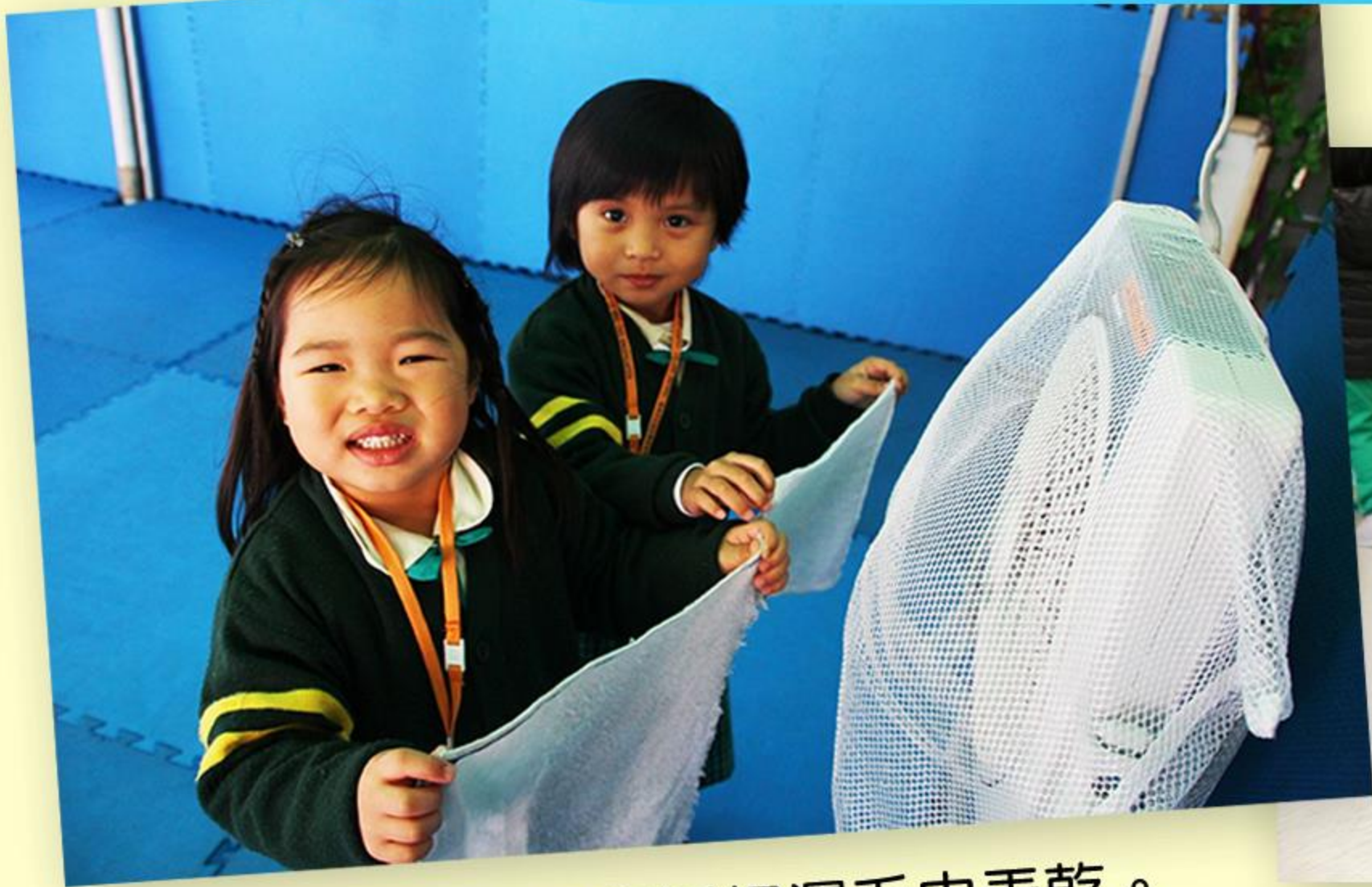
同學們嘗試用風扇把濕毛巾弄乾。

在剛過去的農曆新年活動中，幼班兒童成為學校的好幫手，一起清潔課室，進行大掃除，又從中學習乾濕的概念。