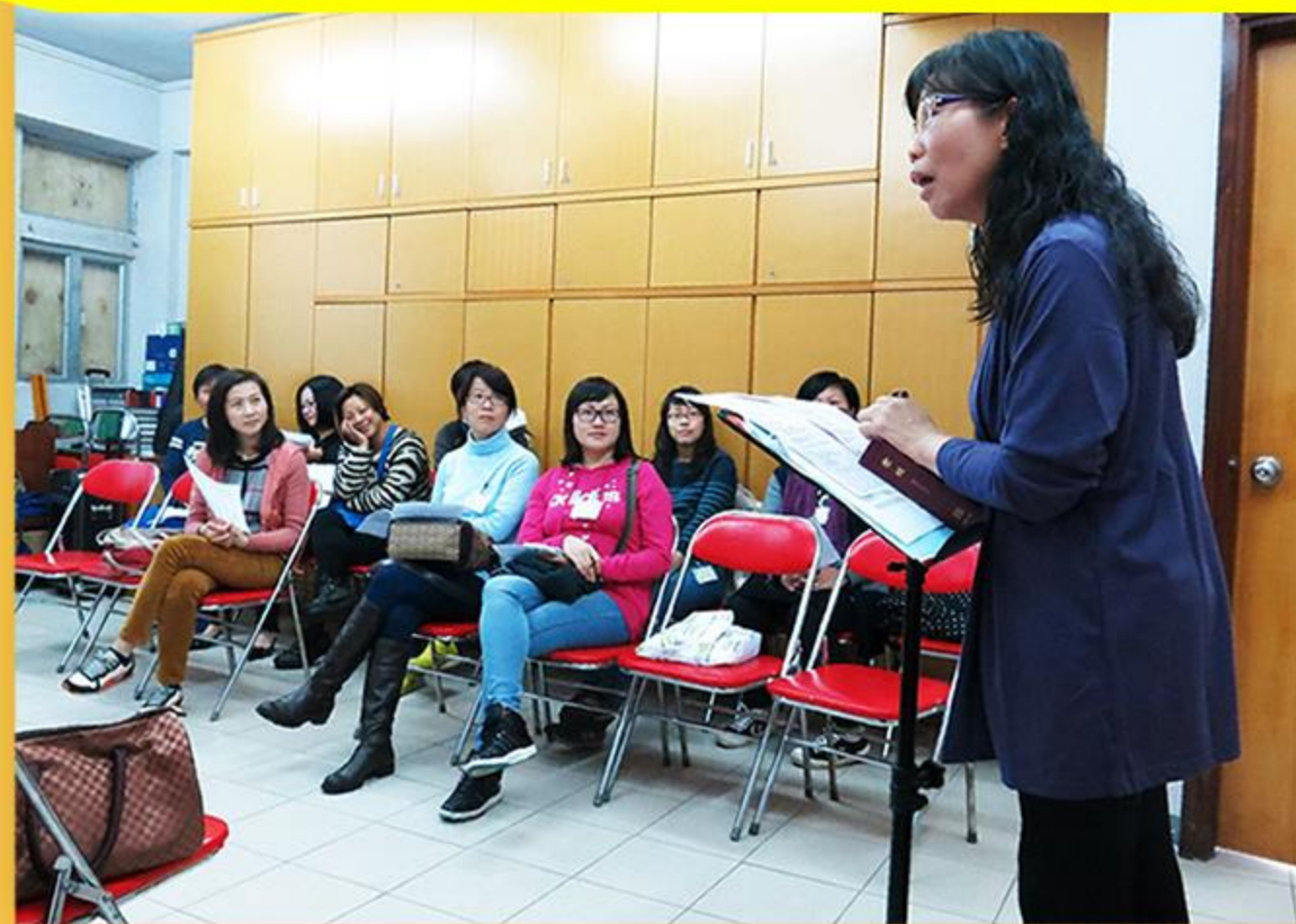
蘇校董透過生活經驗分享，與家長一起探討逆境智能。