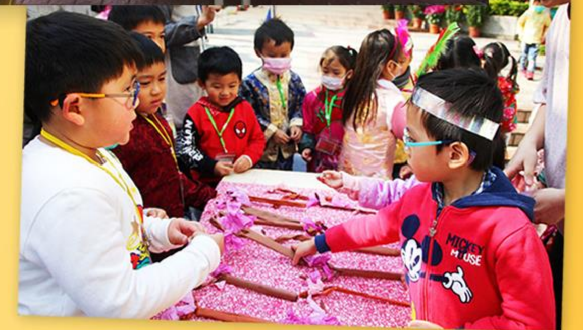
「你看，這枝桃花很美啊！」