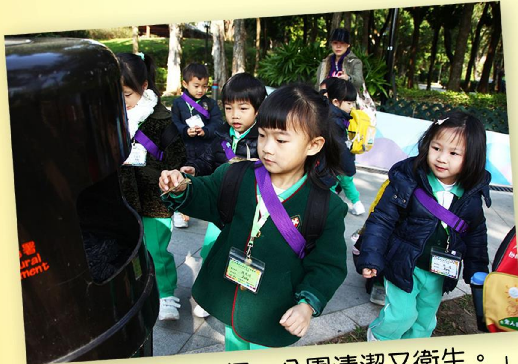
「樹葉放進垃圾桶，公園清潔又衛生。」