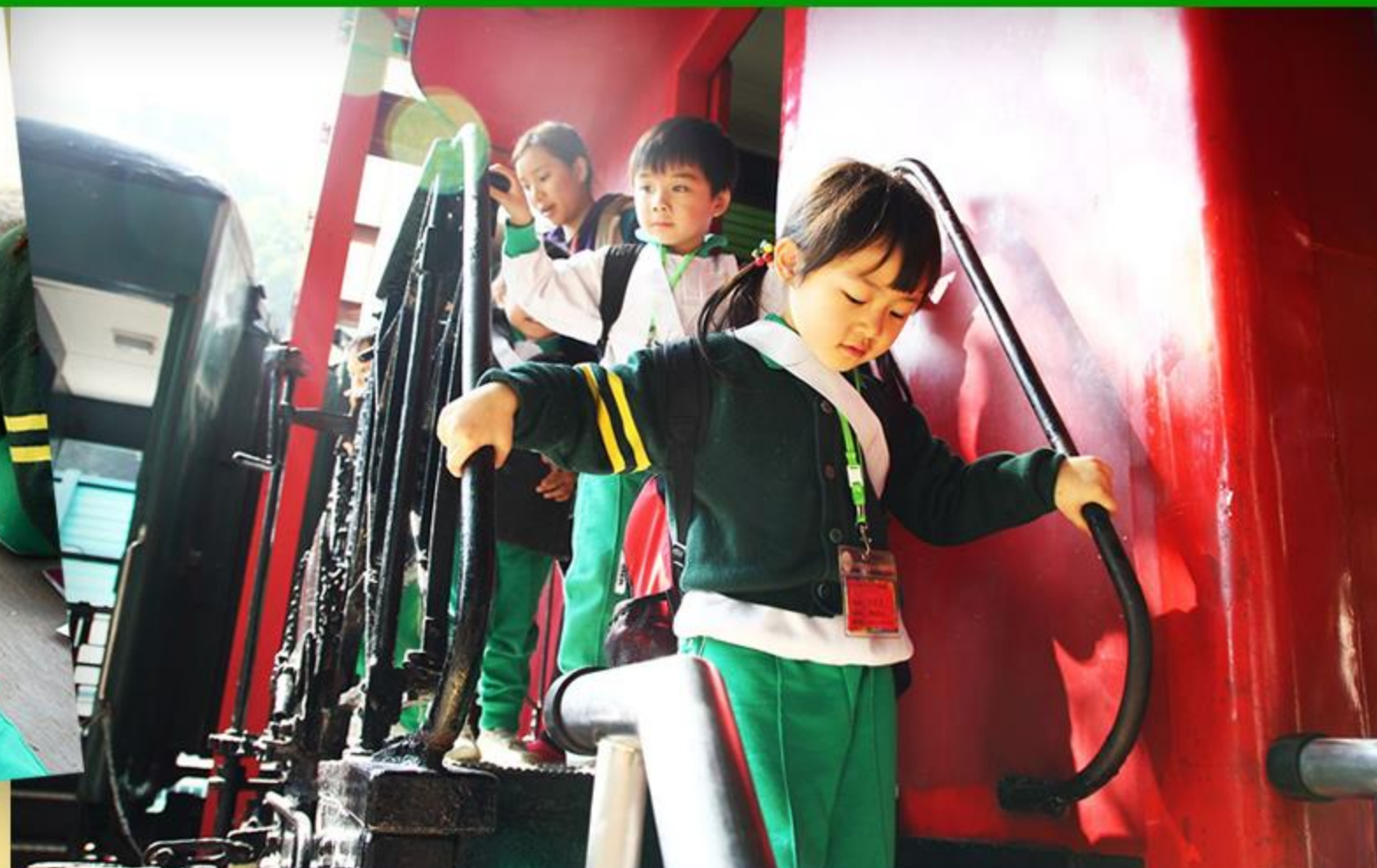
兒童們從舊式火車中走出來，就像穿越時空一樣。