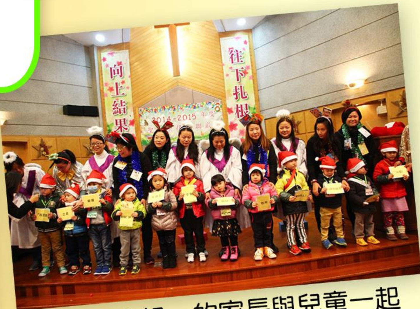
「親親小組」的家長與兒童一起慶祝。