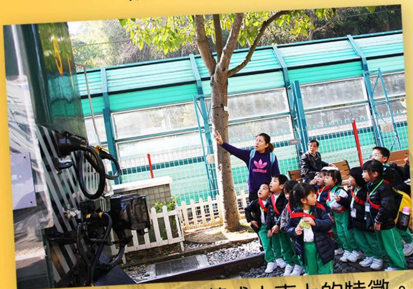
學生們仔細觀察舊式火車上的特徵。