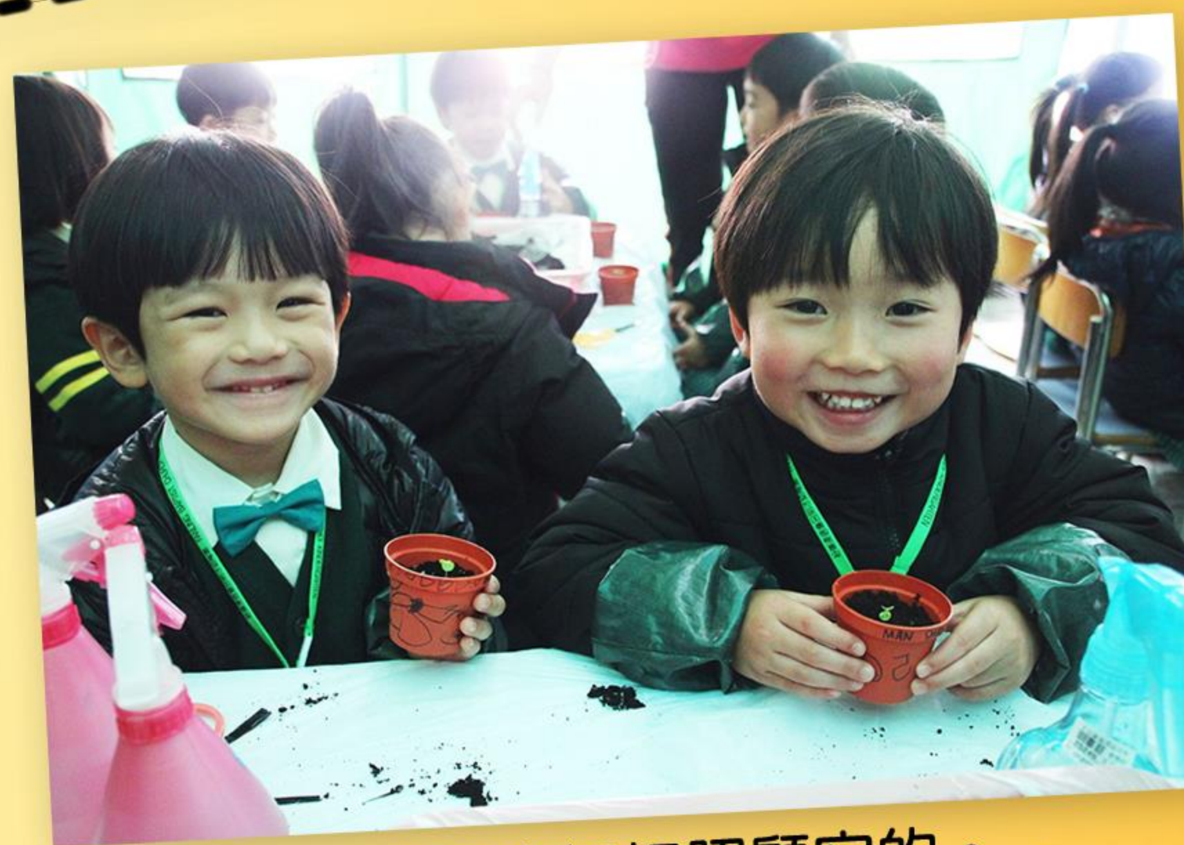
「我會好好照顧它的。」