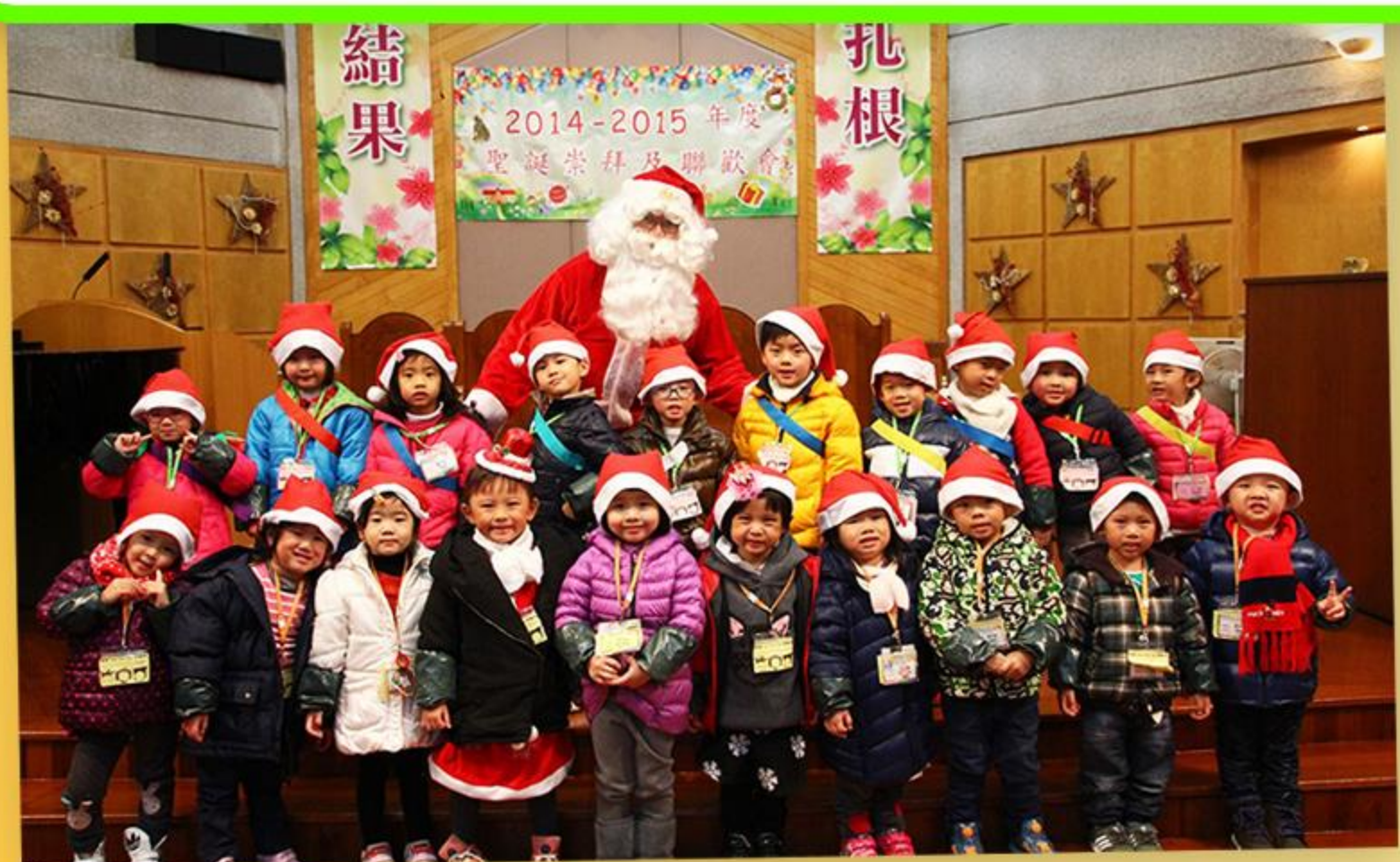
聖誕老人陪小朋友一起過聖誕。