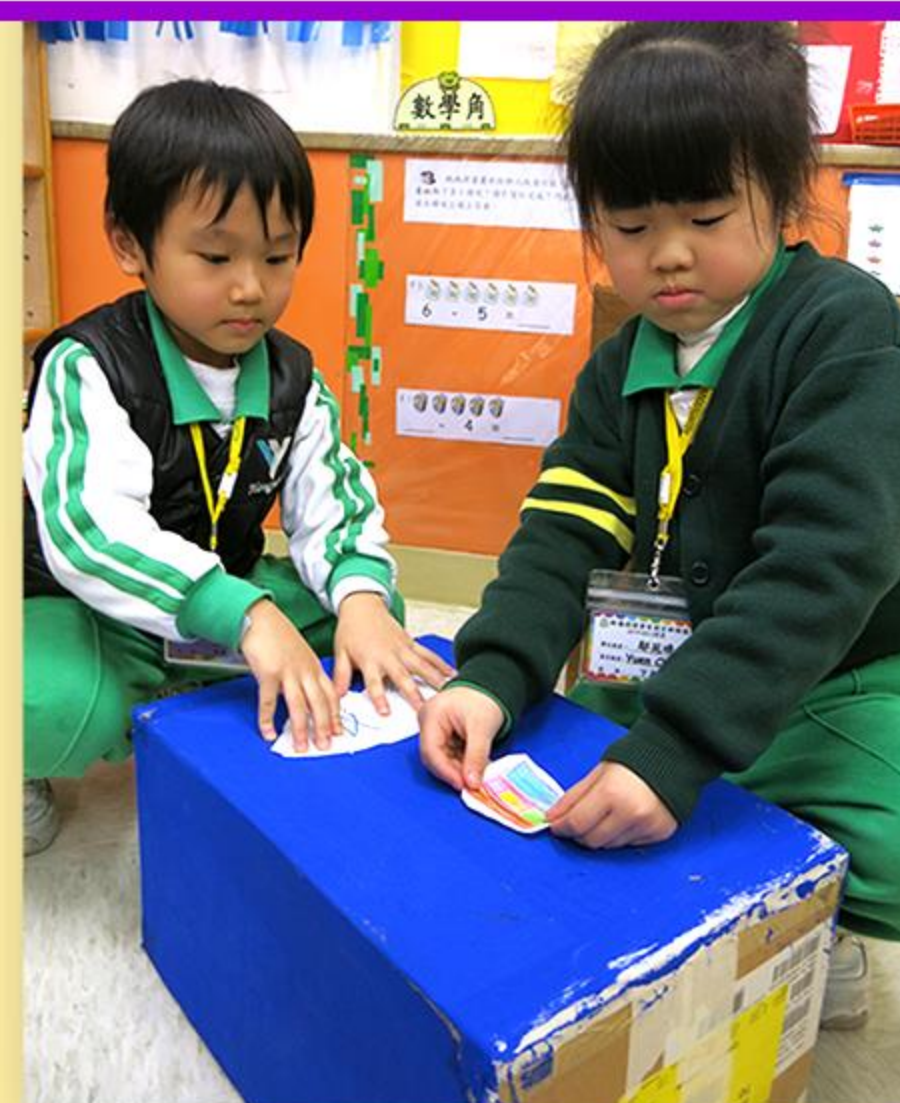
大家一起利用紙箱來製作環保回收箱。