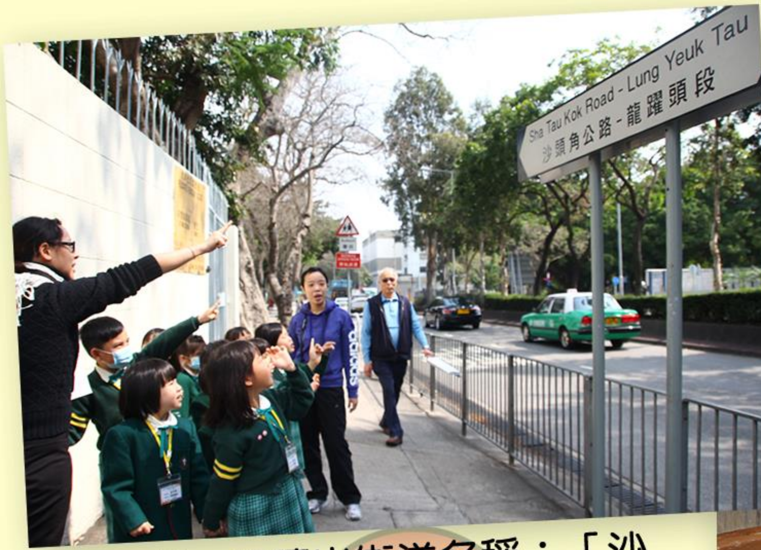
兒童一起讀出街道名稱：「沙頭角公路 — 龍躍頭段」。