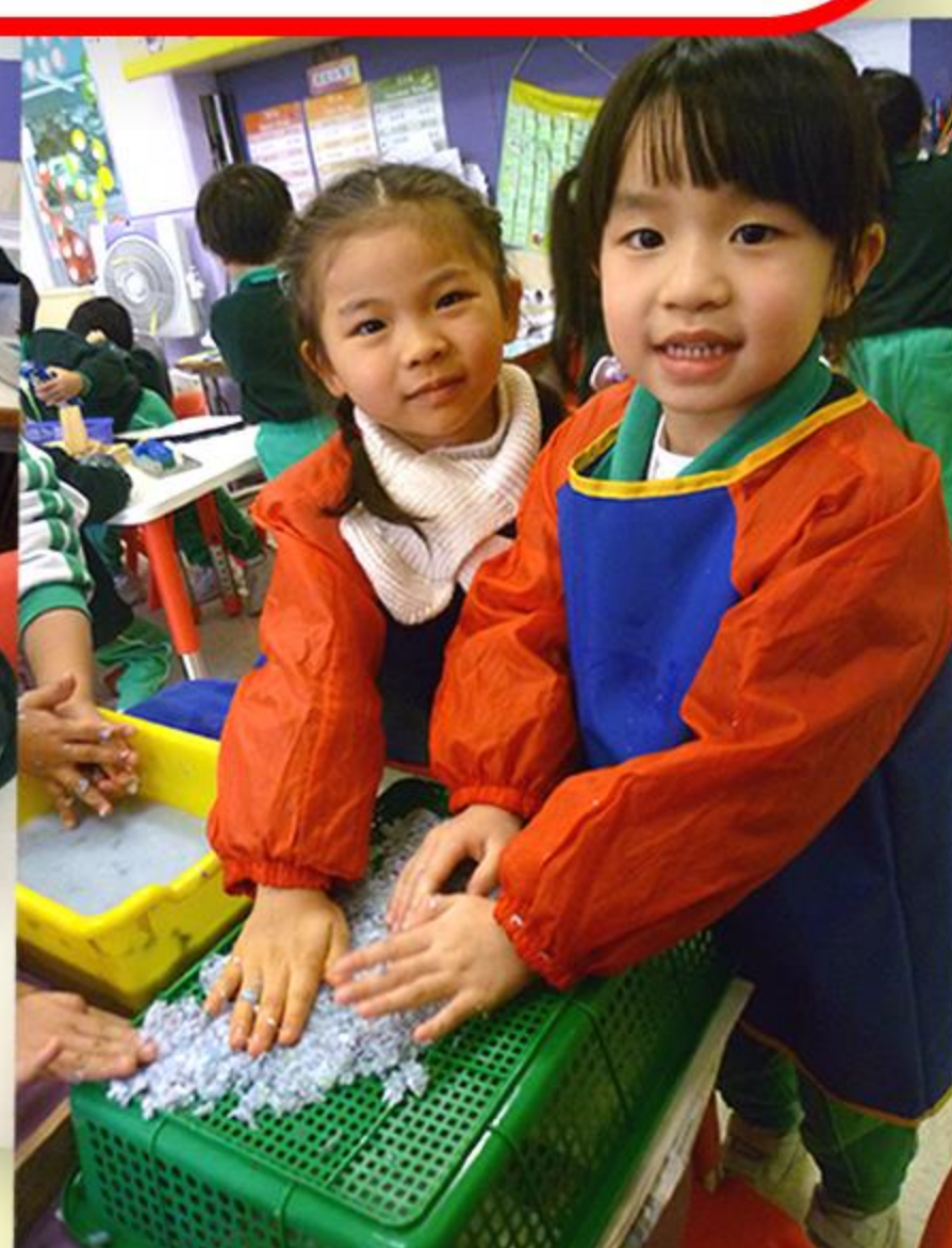
兒童把紙糊平鋪在筲箕，並按壓以隔去水份。

在有關寵物的主題中，兒童一起在學校飼養小烏龜，不但在分組時與烏龜傾談，還會觀察牠的動態，真有趣！