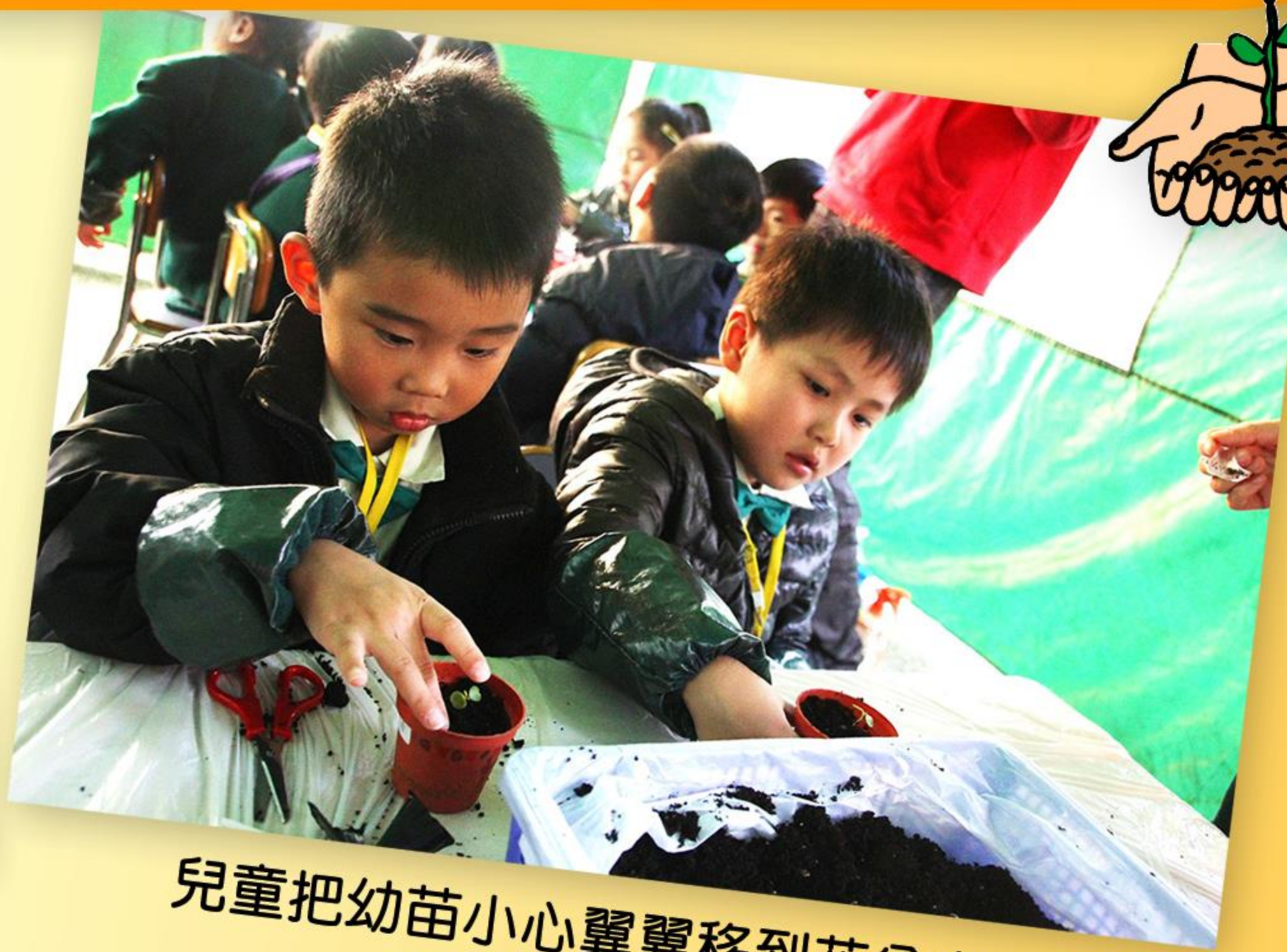
兒童把幼苗小心翼翼地移到花盆中。