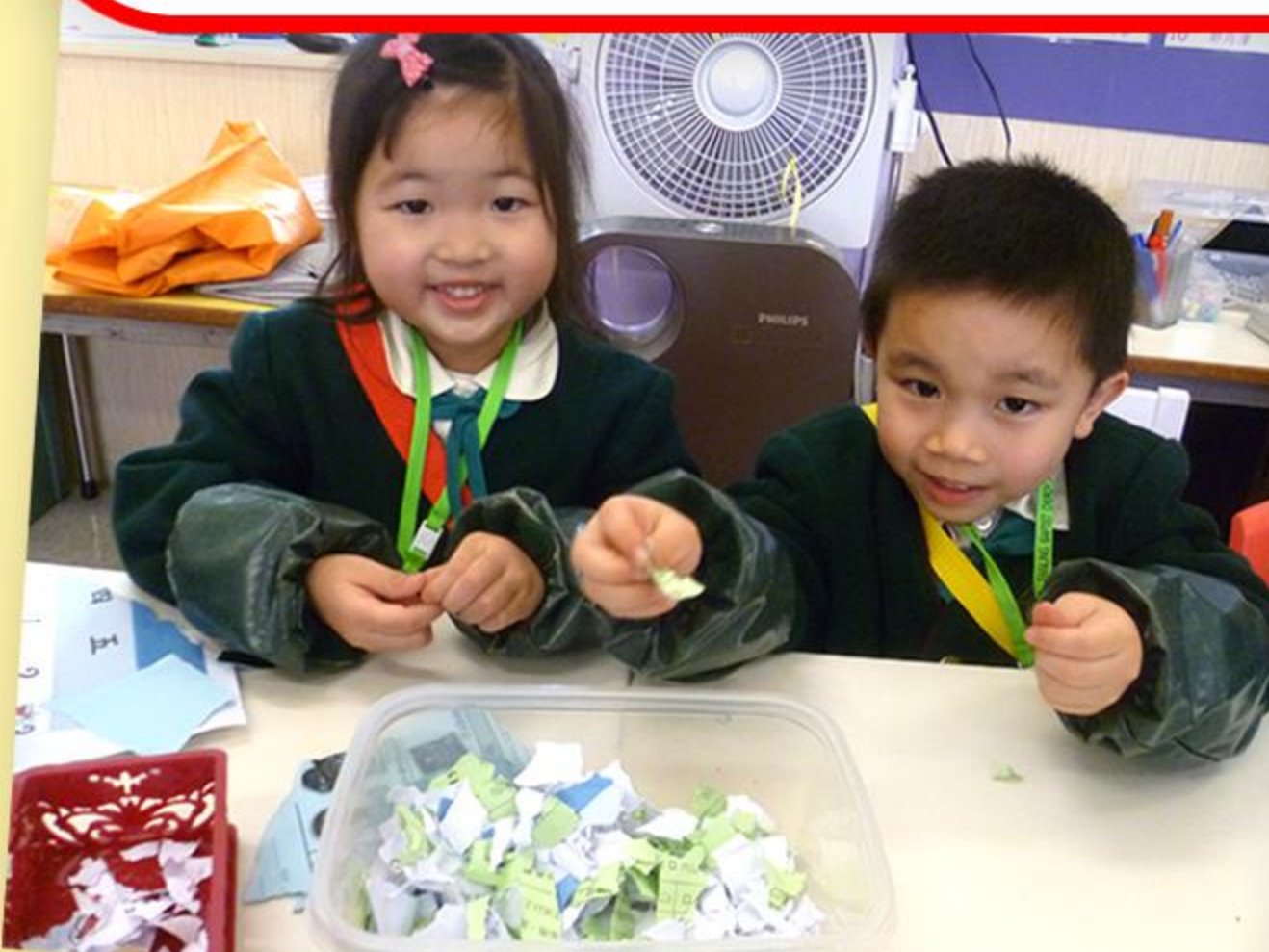
兒童合作把廢紙撕碎。