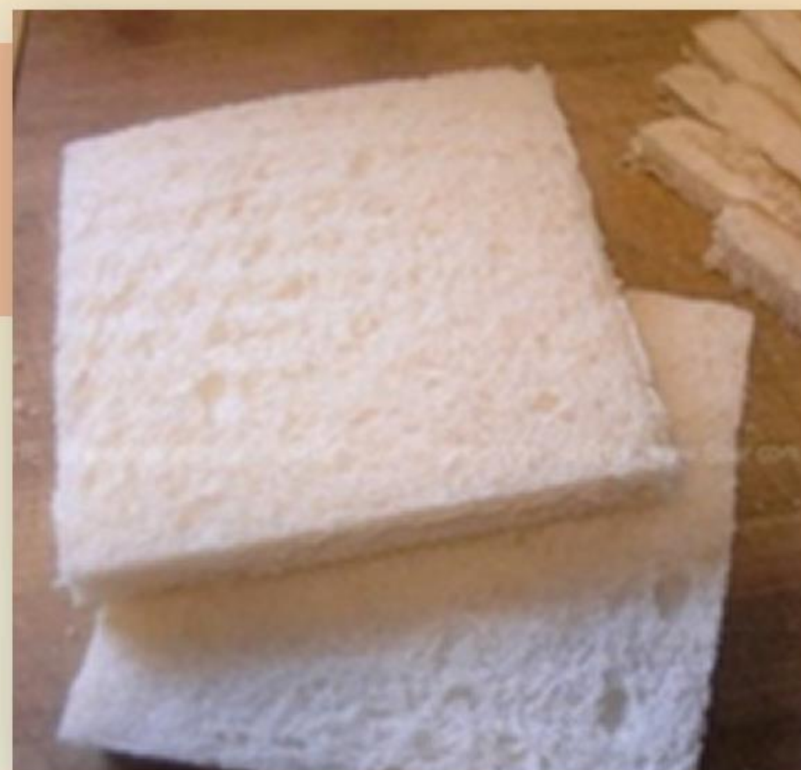
1. 方包切邊，再從對角切一半。