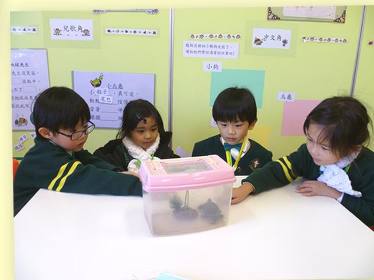
爬！爬！爬！烏龜慢慢爬。