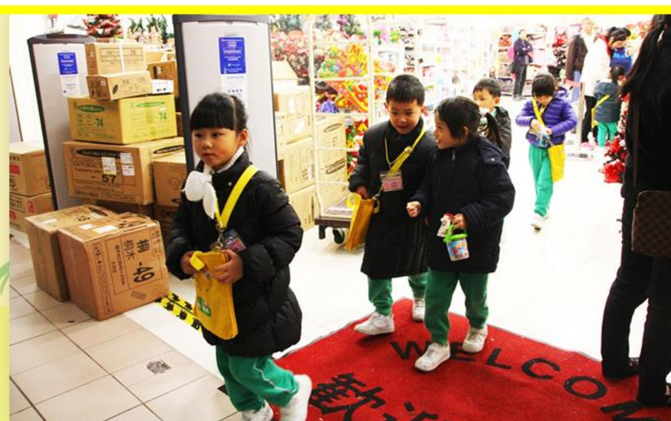
買到心儀的禮物，真開心！