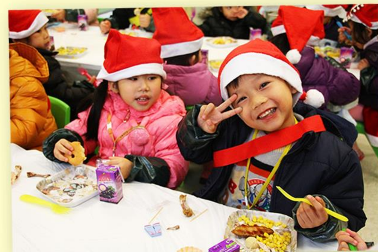
「聖誕大餐好好味啊！」