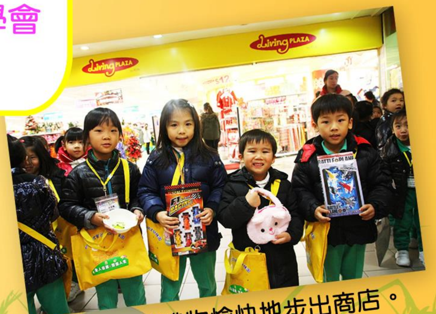
兒童拿着禮物愉快地步出商店。