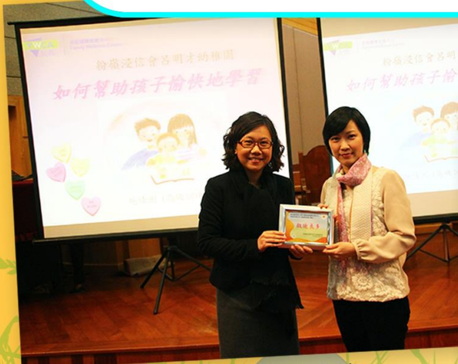
多謝施姑娘的分享。