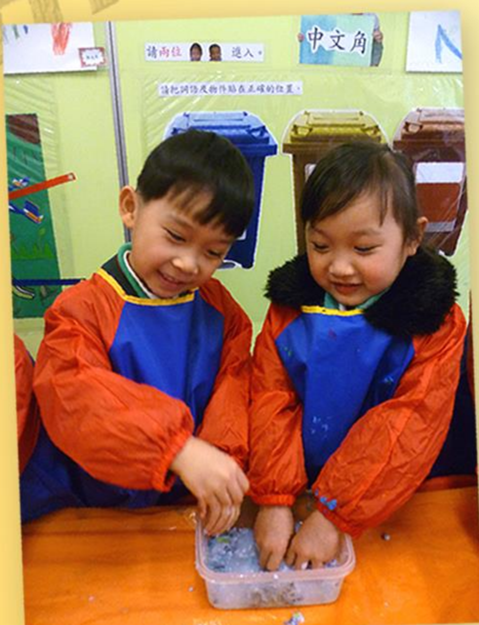
同學們把碎紙浸在水中成紙糊。