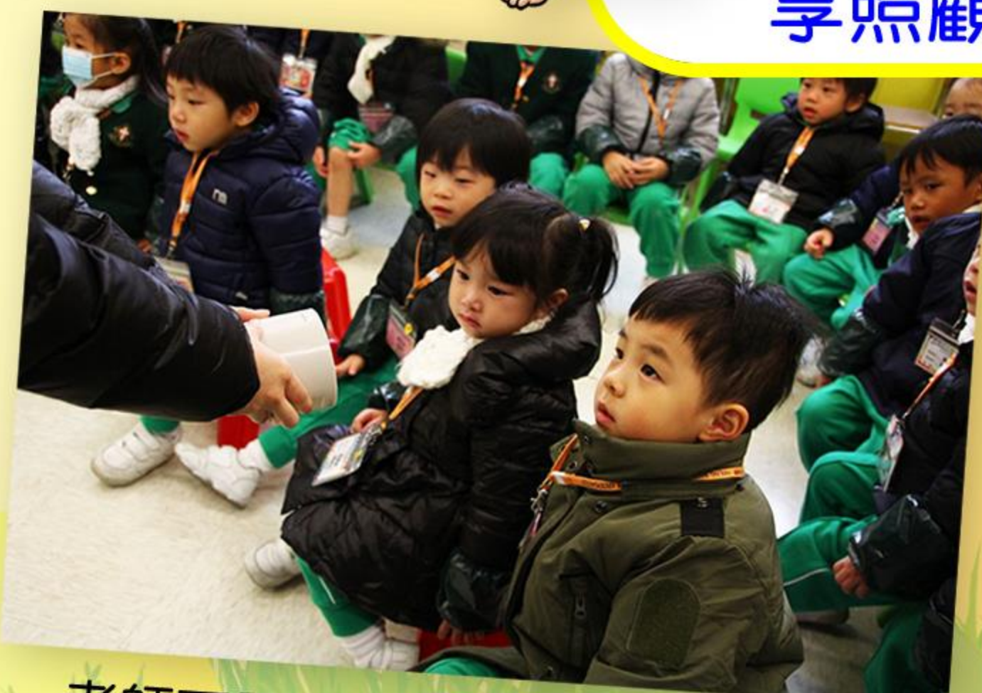
老師正展示嬰兒用品給同學觀察。