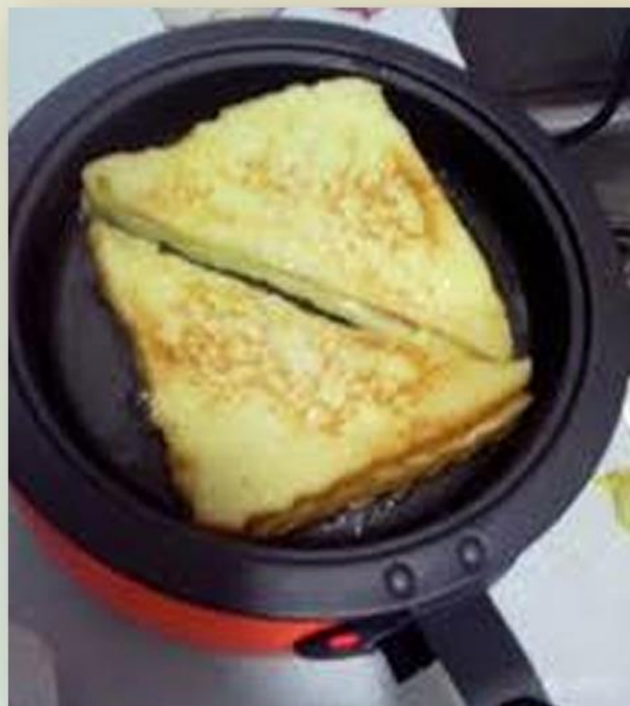
4. 放入鑊內煎炸至金黃色。