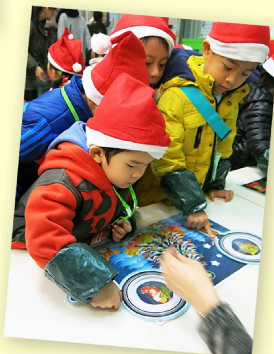
聖誕攤位遊戲，兒童樂在其中！