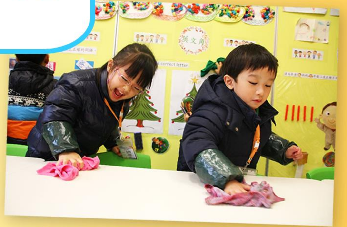
用力擦一擦，檯面變得更清潔。