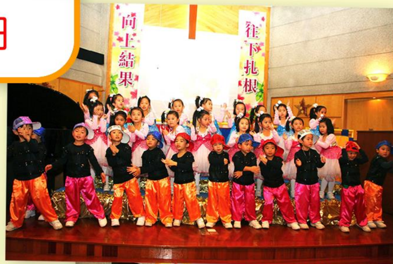
兒童穿上美麗的服飾演繹精彩的舞蹈。