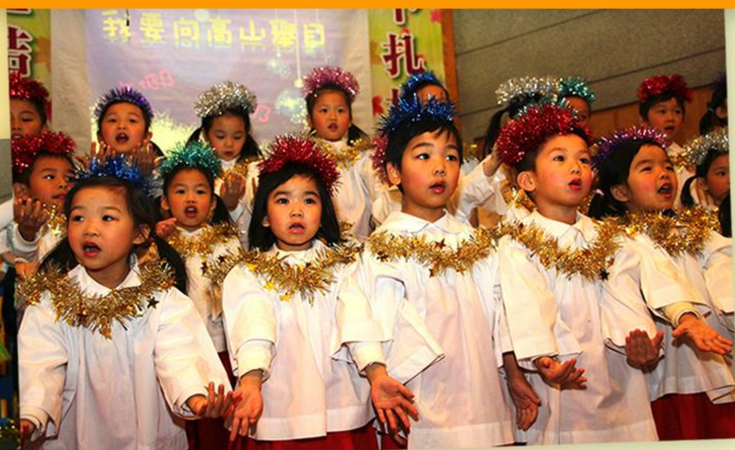
可愛的天使向我們報大喜的信息。