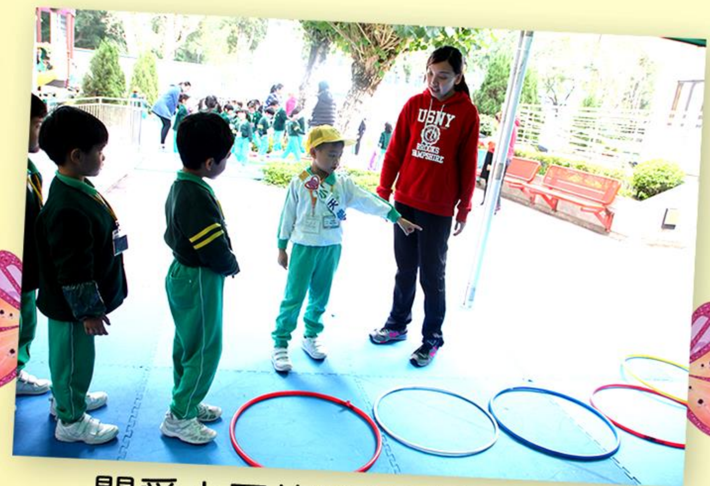
關愛小天使協助體能活動。