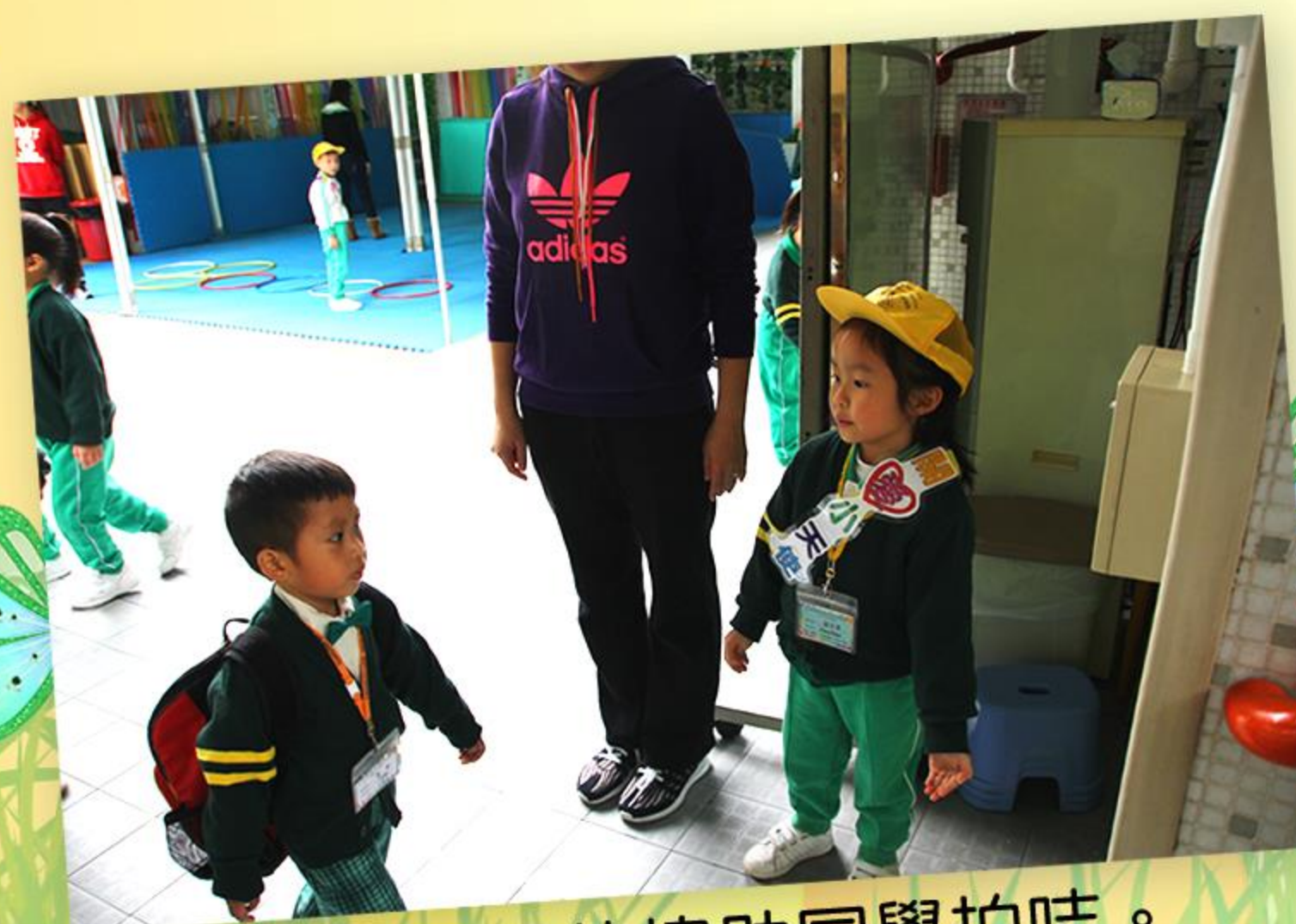
關愛小天使協助同學拍咭。