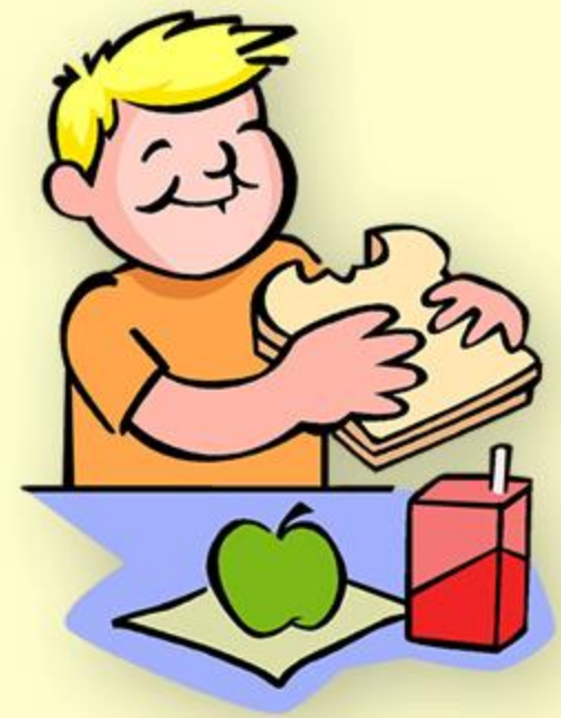
簡寶琴部長分享食物金字塔、幼兒營養飲食與健康飲食新趨勢。