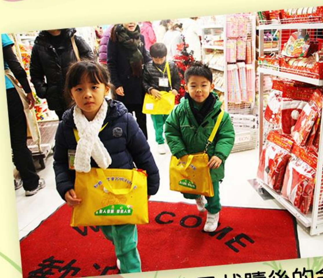
同學們把禮物及找贖後的金錢放好後離開商店。

為讓兒童從親身體驗中學習理財的概念，老師帶同兒童一起前往購物。當天兒童不但為同學挑選合適的聖誕禮物，而且學會正確的購物程序。