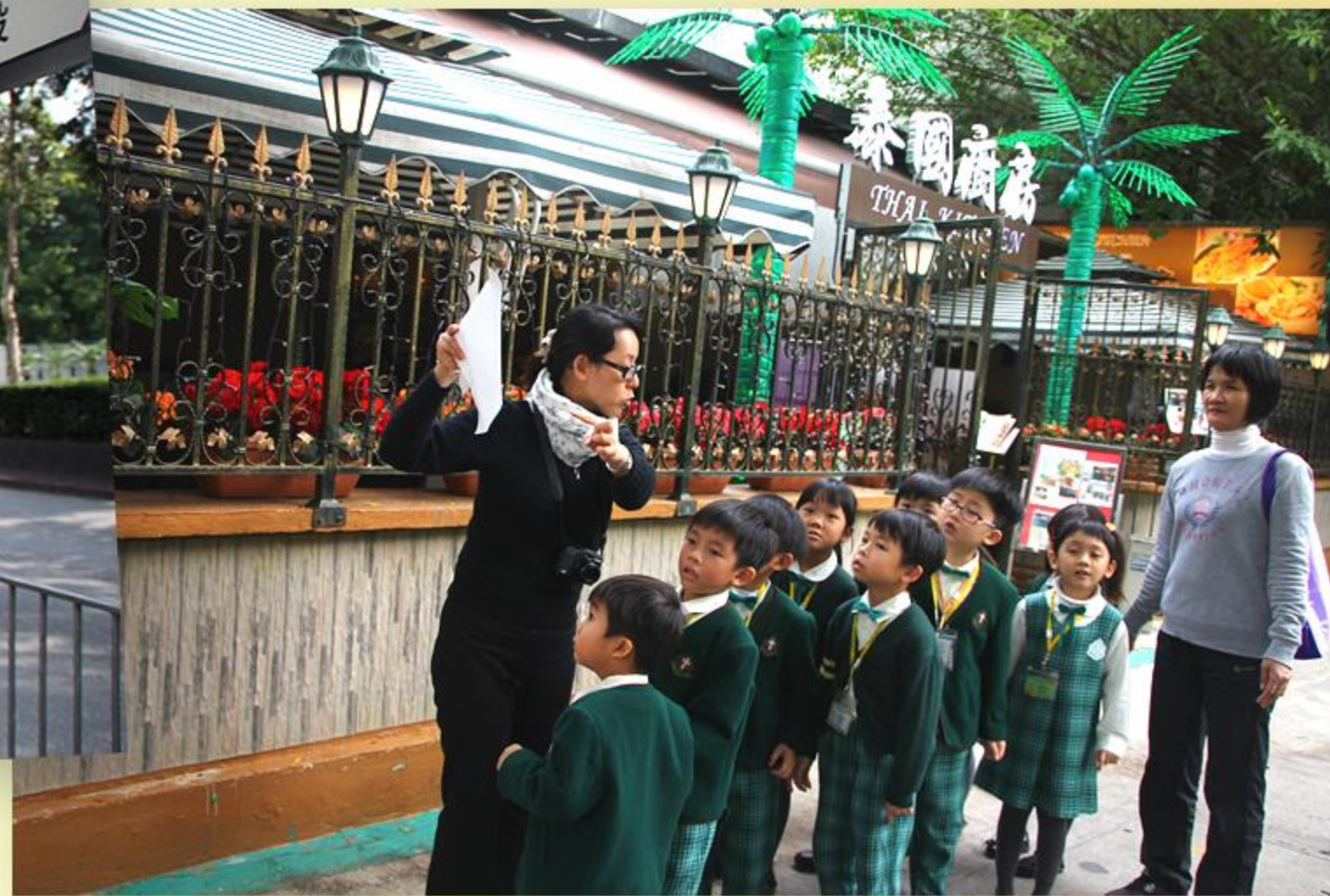
兒童一同認識海關總部在地圖上的位置。