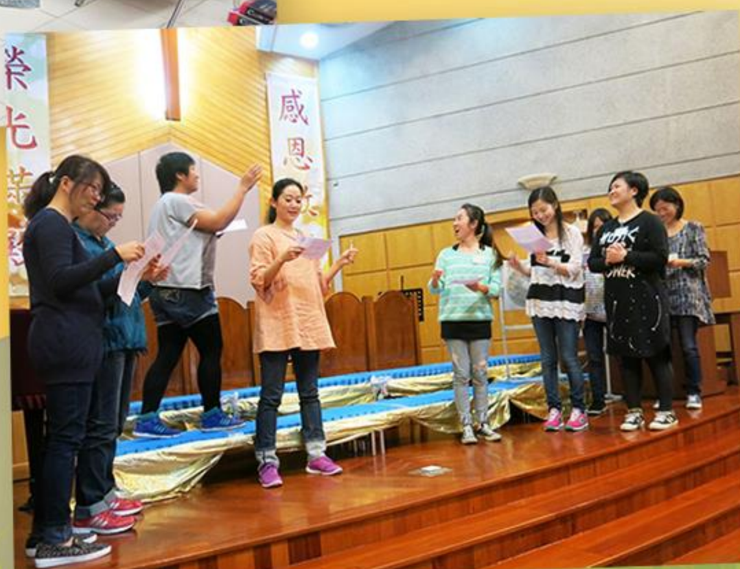
家長正綵排「復活節崇拜」中的話劇表演。