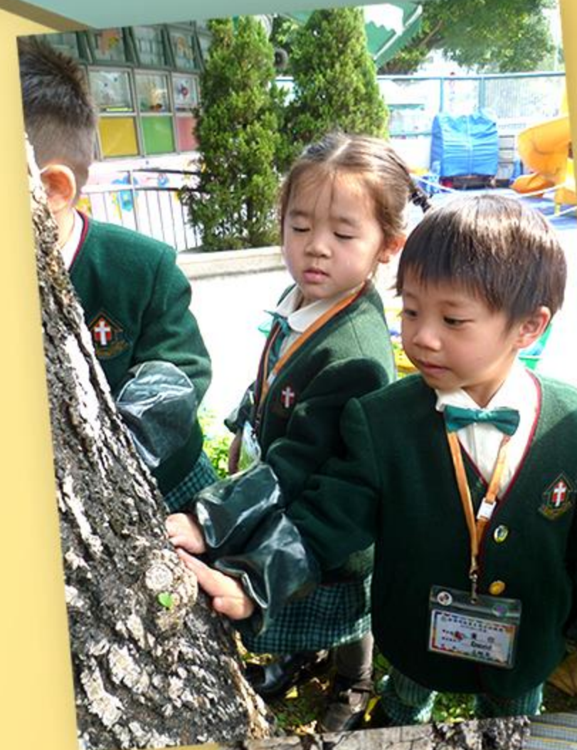
同學們用手觸摸大樹的樹幹，發現樹幹是很粗糙的。