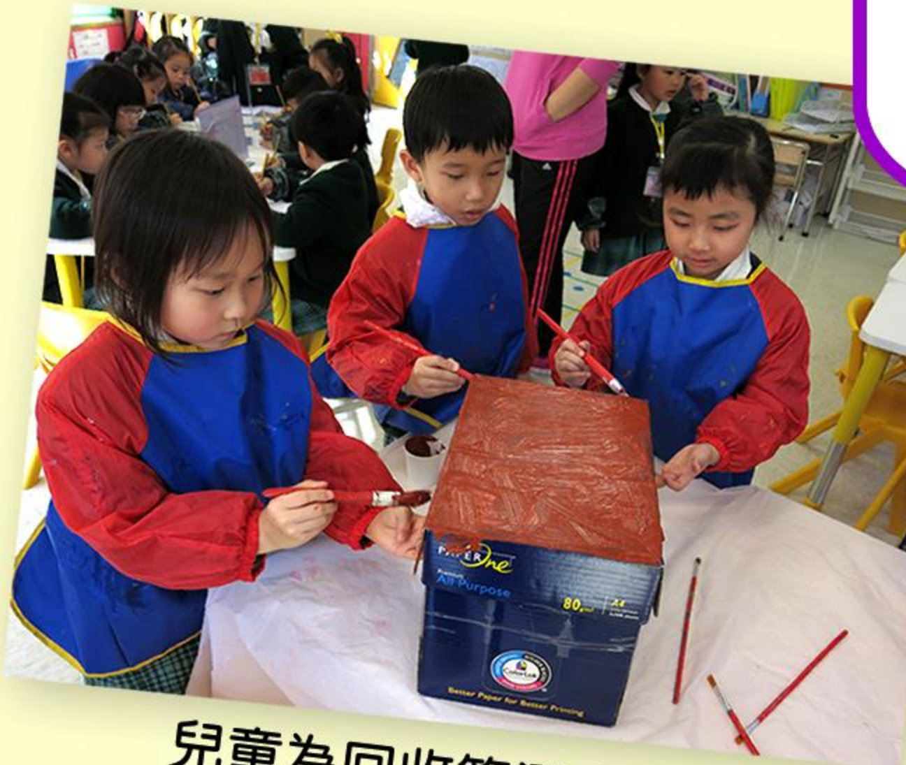
兒童為回收箱添上色彩。

為配合「環保」的主題，高班兒童在「德育週」中合作製作回收箱，並且把回收箱帶到低、幼班中作推廣，讓全校兒童也認識到「循環再用，珍惜資源」的重要性。