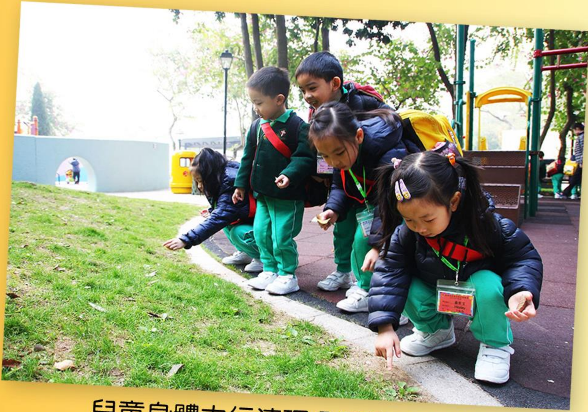
兒童身體力行清理公園內的樹葉。